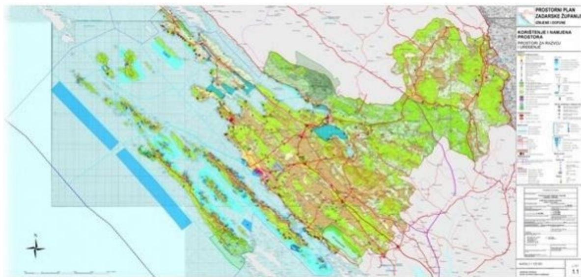
Slika 1 - Prostorni obuhvat

Po popisu stanovništva iz 2011. godine u Zadarskoj županiji živi 170.017 stanovnika, od čega je 83.504 muškaraca i 86.513 žena 1 , čime dolazimo do broja od 46,66 stanovnika po km 2 . 2