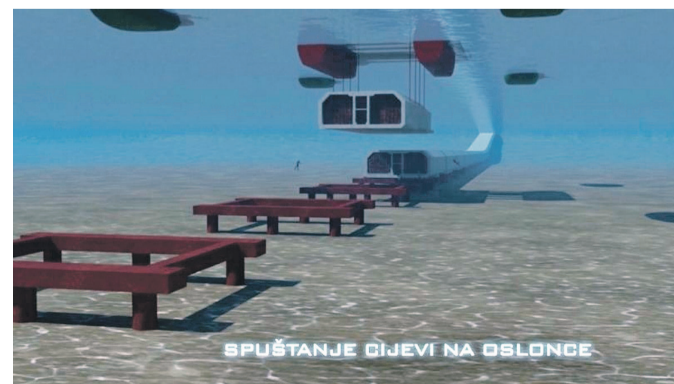
Prikaz kako bi se tunelske cijevi spuštale na oslonce

Kao što smo i najavili, želimo što više biti na terenu kako bi se bolje upozнали s izazovima s kojima se suočavaju naše jedinice lokalne samouprave. Tijekom posjeta općinama Pašman i Tkon, upoznali smo se s njihovim razvojnim projektima i iznimno mi je drago da se rješava problem odvodnje na cijelom otoku projektom biogradske