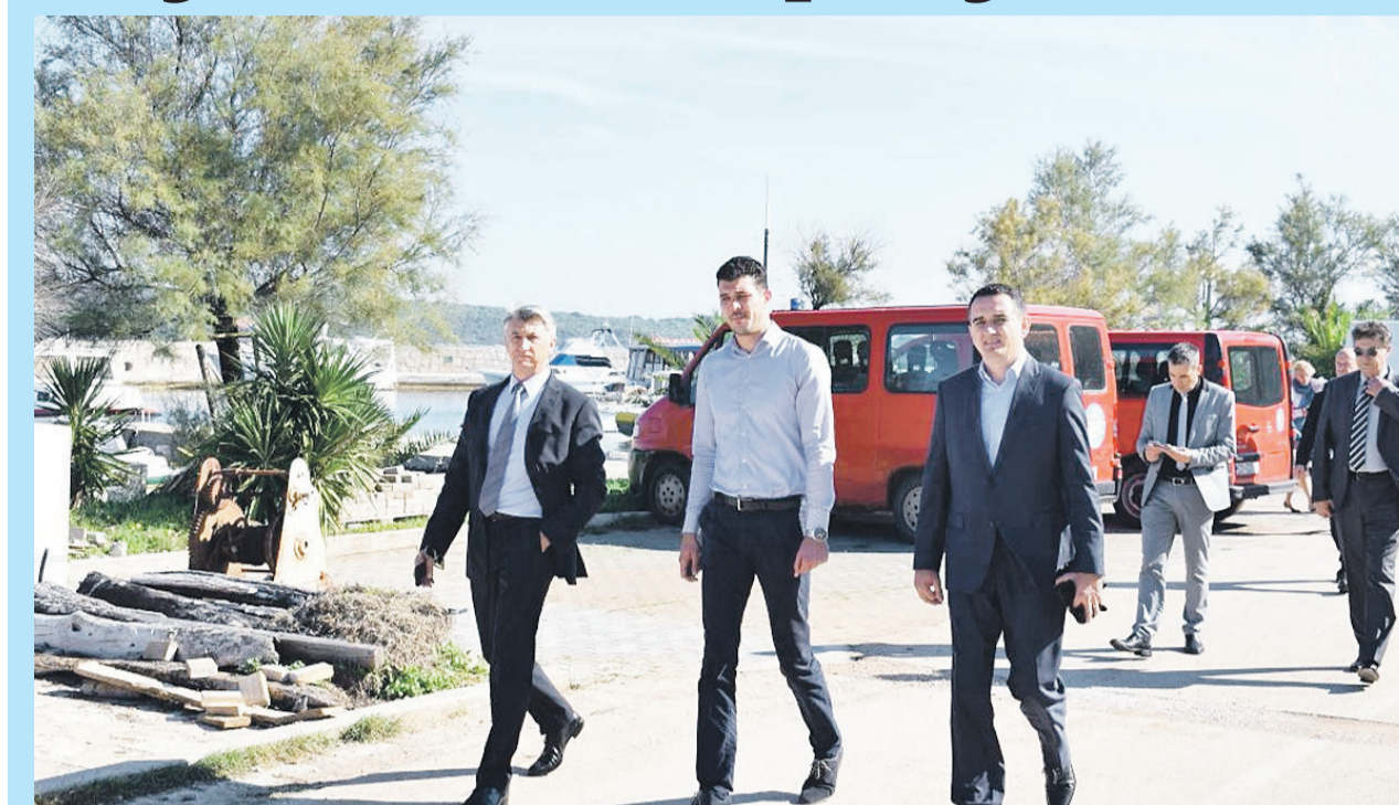
Županijsko izaslanstvo razgledalo je dio Pašmana

Županijska lučka uprava vodi projekt izgradnje nove trajektne luke u Tkonu. Ukupna vrijednost projekta je 40 milijuna kuna, a do sada je uloženo oko 12 milijuna kuna