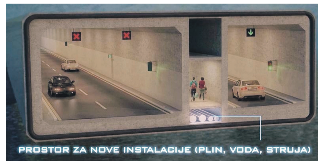
Kroz tunel bi se provukle i instalacije za struju, vodu i plin