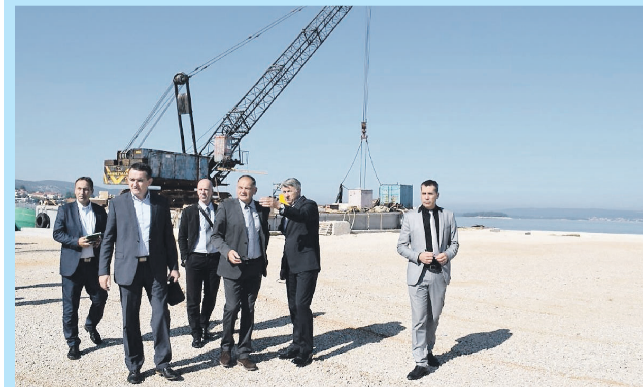
Na gradilištu nove trajektne luke u Tkonu