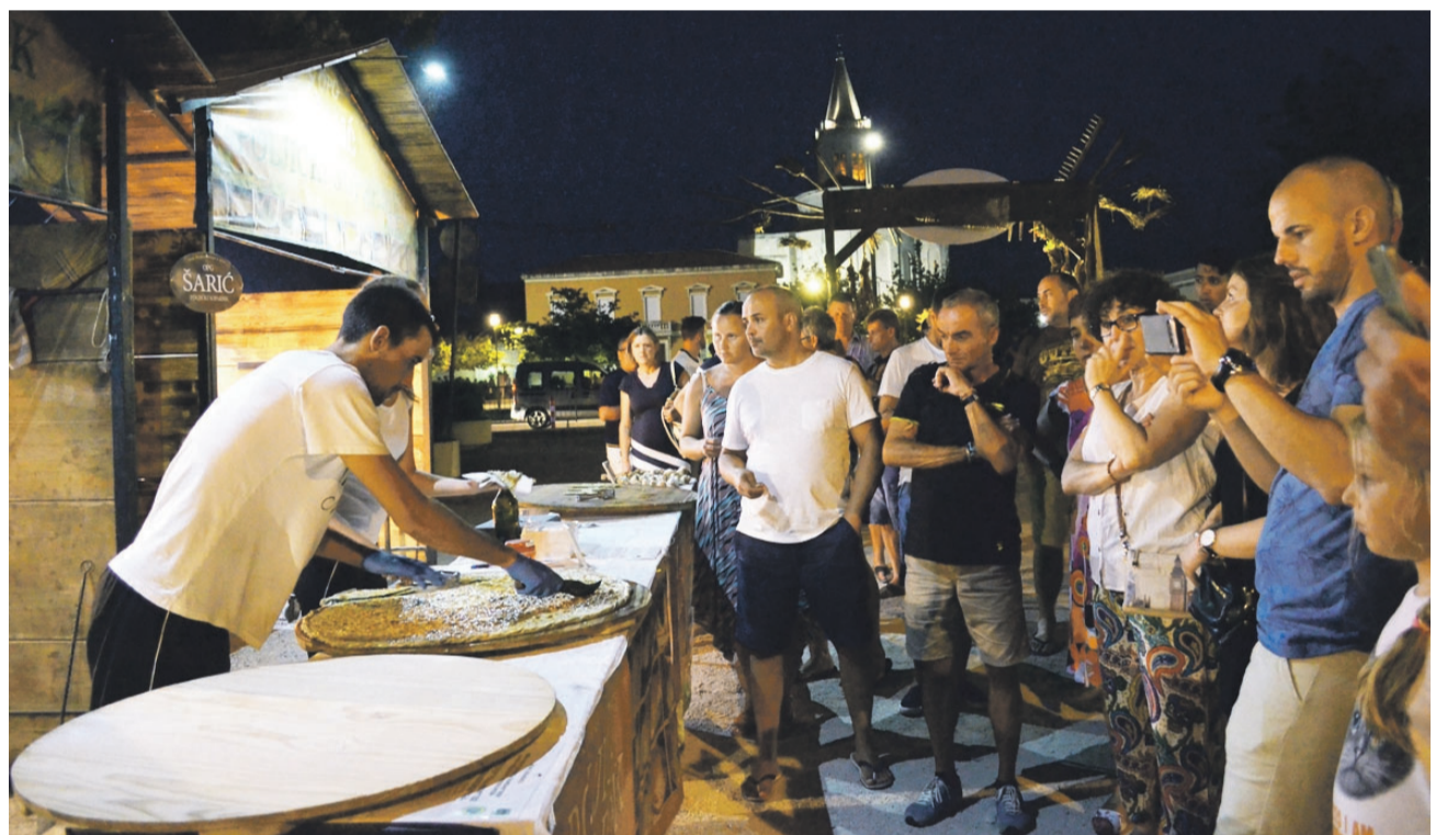
Noć punog miseca