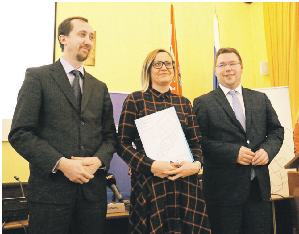
Napokon - posao!

- Ova Vlada do sada je u programe zapošljavanja uložila preko 4 i pol milijarde kuna, ove godine imamo 2 milijarde kuna na raspolaganju gdje se obraćamo ne samo ženama, nego i mladima, osobama s invaliditetom, dugotrajno nezaposlenima i svima onima koji se teže integriraju na tržište rada - naglasio je ministar Pavić i čestitao svim korisnicima, posebice domaćinu, Zadarskoj županiji koja je bila učinkovita i proaktivna u povlačenju sredstava.