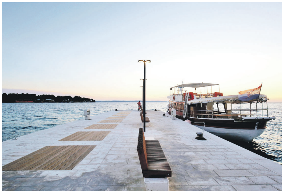
Riva u Petrcanima je sada prekrasna