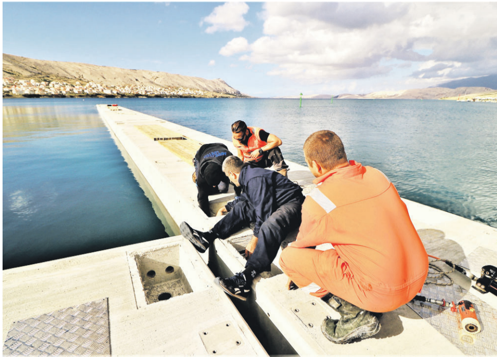
Pag - ponton