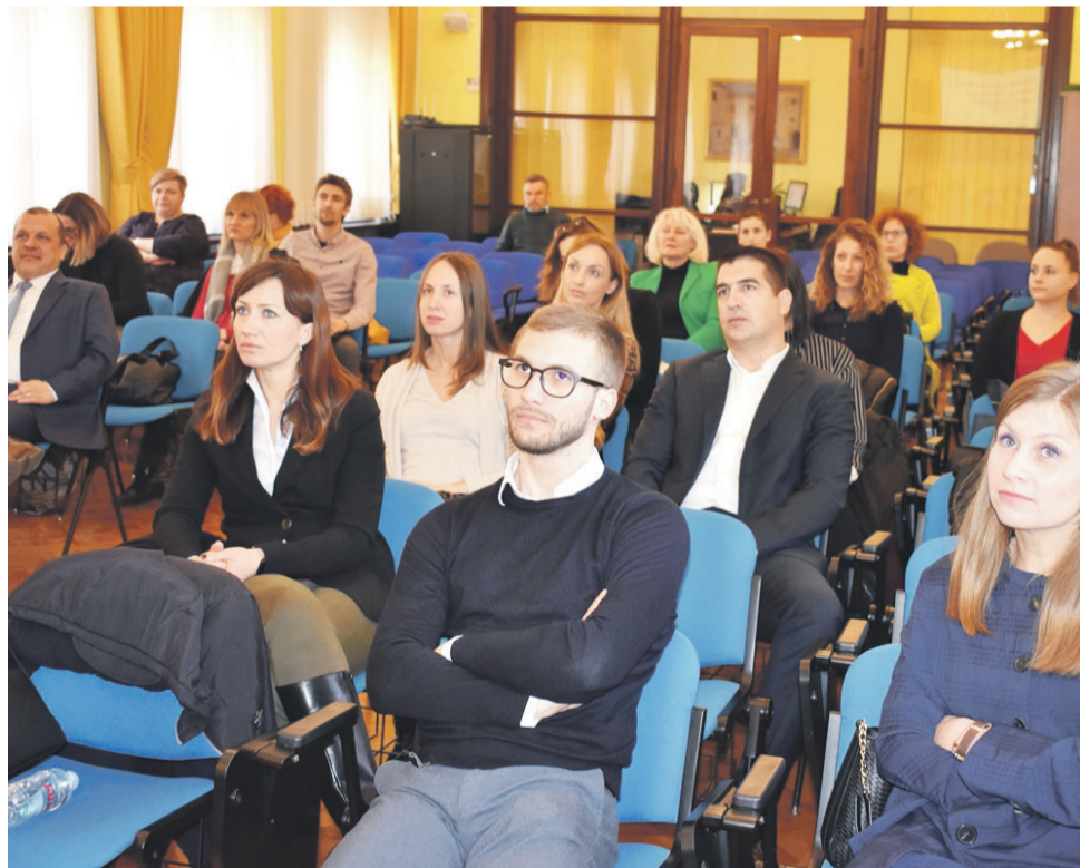
Istraživanje je zanimalo sve koji rade u turizmu

Rezultati istraživanja ocrtaju profil, ponašanje i zadovoljstvo turista korisnika niskotarifnih zračnih prijevoznika u destinaciji Zadar i Zadarska županija. Ispitanici su najvećim dijelom su porijeklom iz Velike Britanije, Njemačke i Francuske, ali i drugih europskih država, što je uvjetovano uspostavljenim zračnim linijama niskotarifnih zračnih prijevoznika. Ispitanici su uglavnom mlađe životne dobi, što je u skladu s tipičnim putnicima koji putuju ovakvim prijevozom.