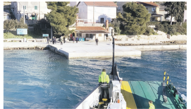
Sanacija pristaništa i dijela rive u luci Ošljak

Naime, od 1998. godine, odnosno svog osnutka, Županijska lučka uprava Zadar aktivno radi na razvoju i održavanju lučke infrastrukture. Planom razvoja i uređenja lučkih područja u Zadarskoj županiji obuh-