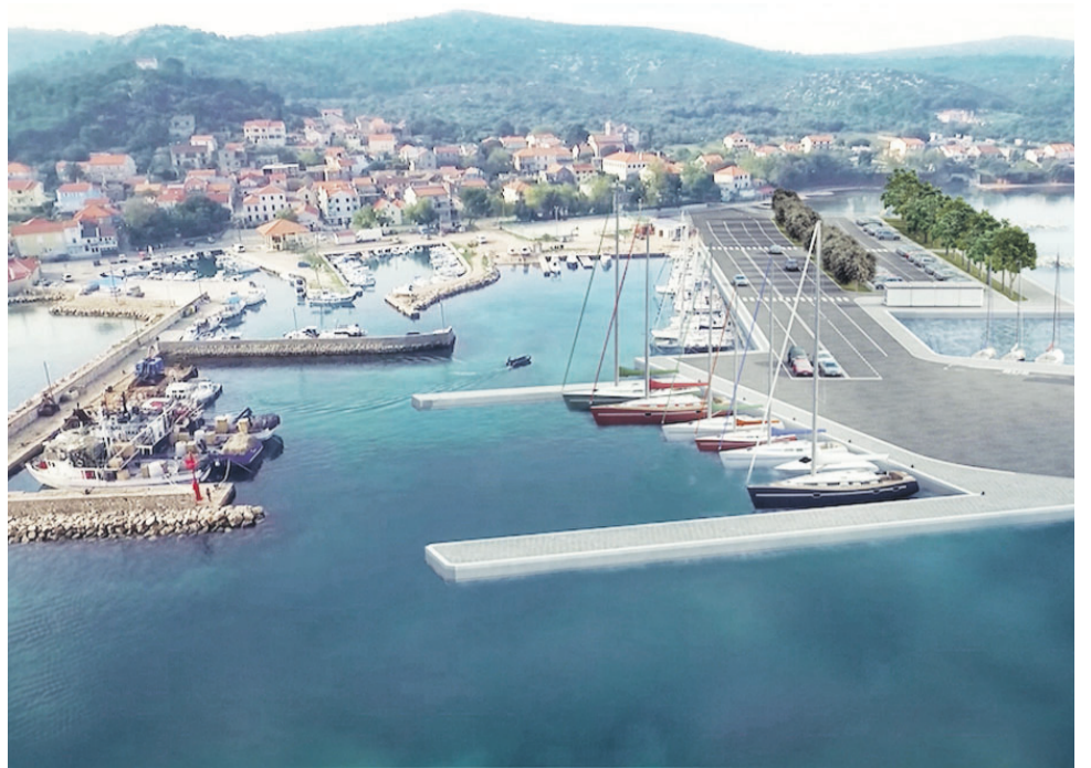
Ovako će izgledati luka u Tkonu