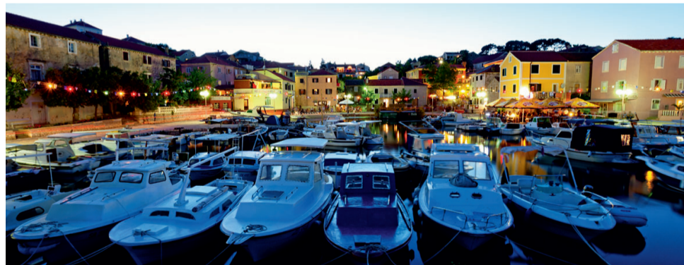
Dogradnja luke Sali

U 2019. godini Županijska lučka uprava Zadar planira investirati ukupno 35.853.438,00 kuna u projekte rekonstrukcije i sanacije luka otvorenih za javni promet u Zadarskoj županiji.