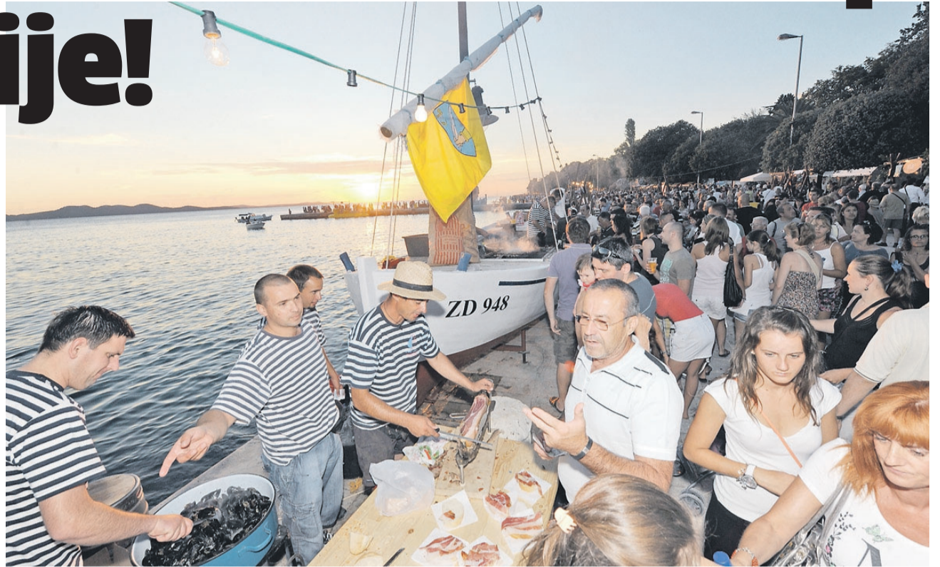
Ovako je bilo lani...

- Cilj Zadarske županije je stalno unaprjeđenje i jačanje turističke ponude posebice tijekom, ali i u predsezoni i posezoni te na turistički nerazvijenim područjima. Samo na taj način možemo doći do željenog cilja, a to je cjelogodišnje poslovanje u