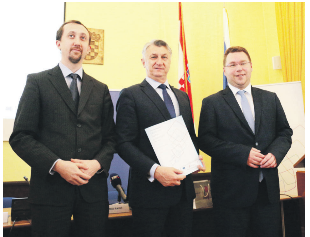
Zadovoljstvo zbog potpisanih ugovora