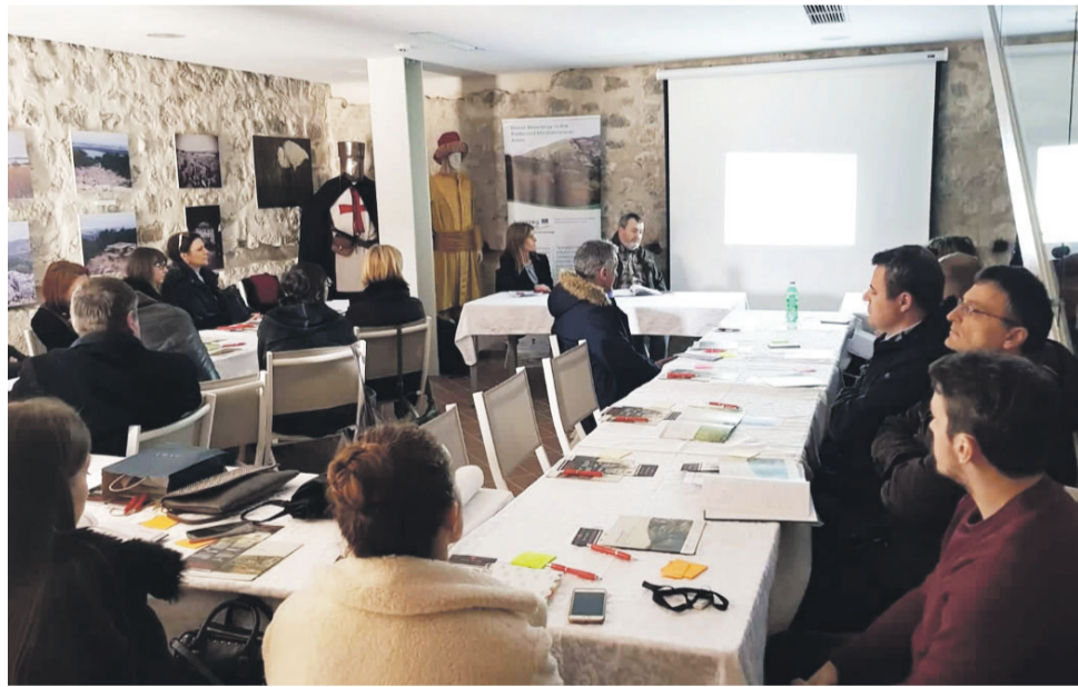
Tehnički panel u Maškovića hanu

Zaključeno je da inicijative od javnih institucija već postoje, ali da je za aktivnije uključivanje privatnog sektora potrebna veća uključenost tijela državne uprave koje bi propisima i subvencijama omogućile ekonomsku isplativost investicija u sustave za korištenje drvene biomase.