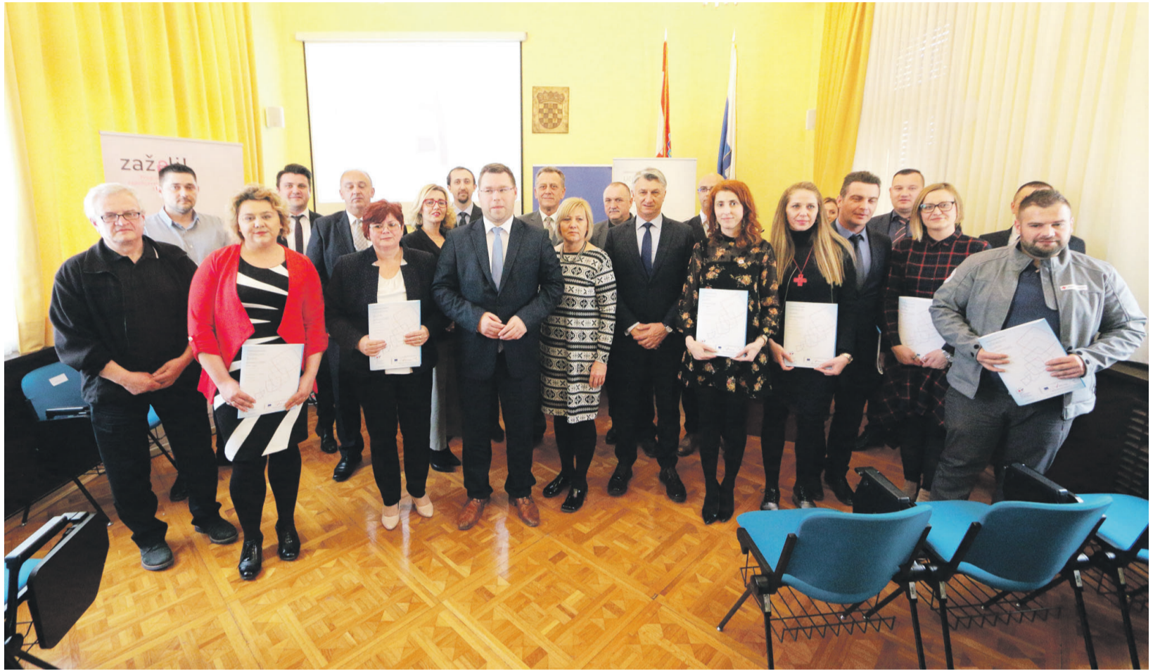
Potpisivanje ugovora u Županiji

- Osim navedenog, ovaj će projekt utjecati i na smanjivanje potrebe za institucio-