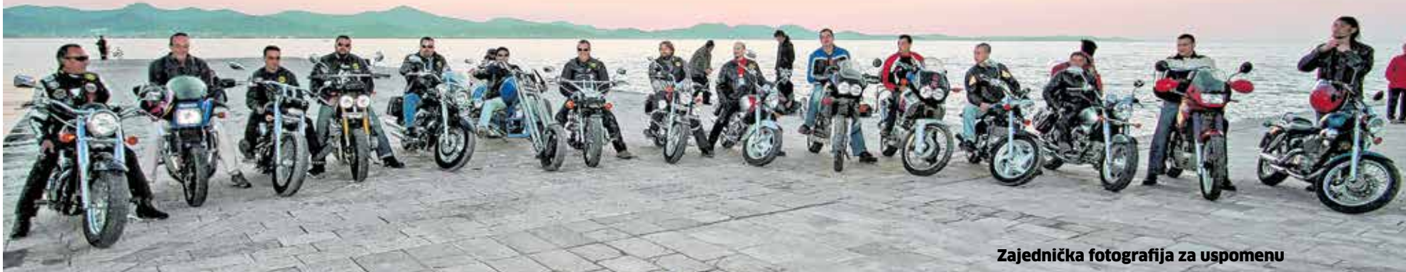
Zajednička fotografija za uspomenu