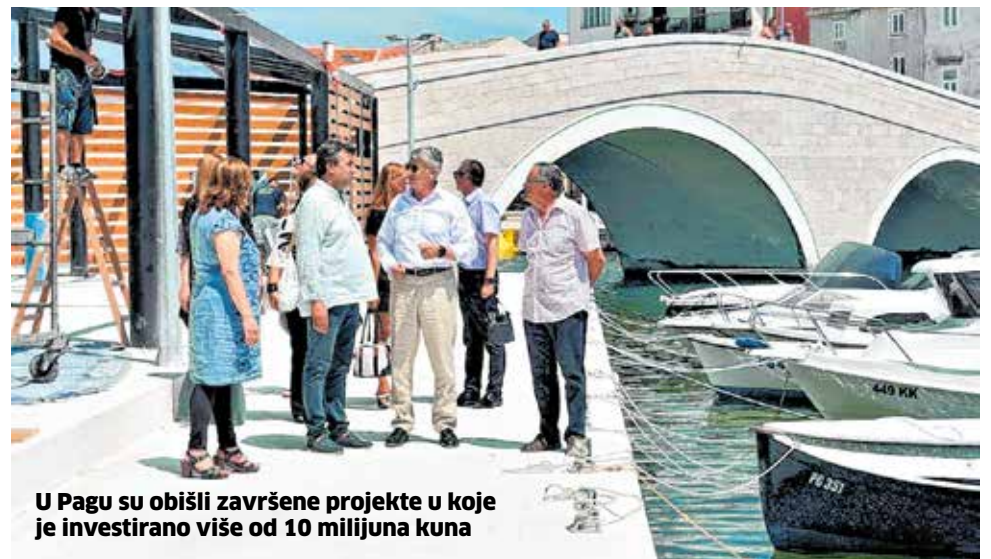
U Pagu su obišli završene projekte u koje je investirano više od 10 milijuna kuna