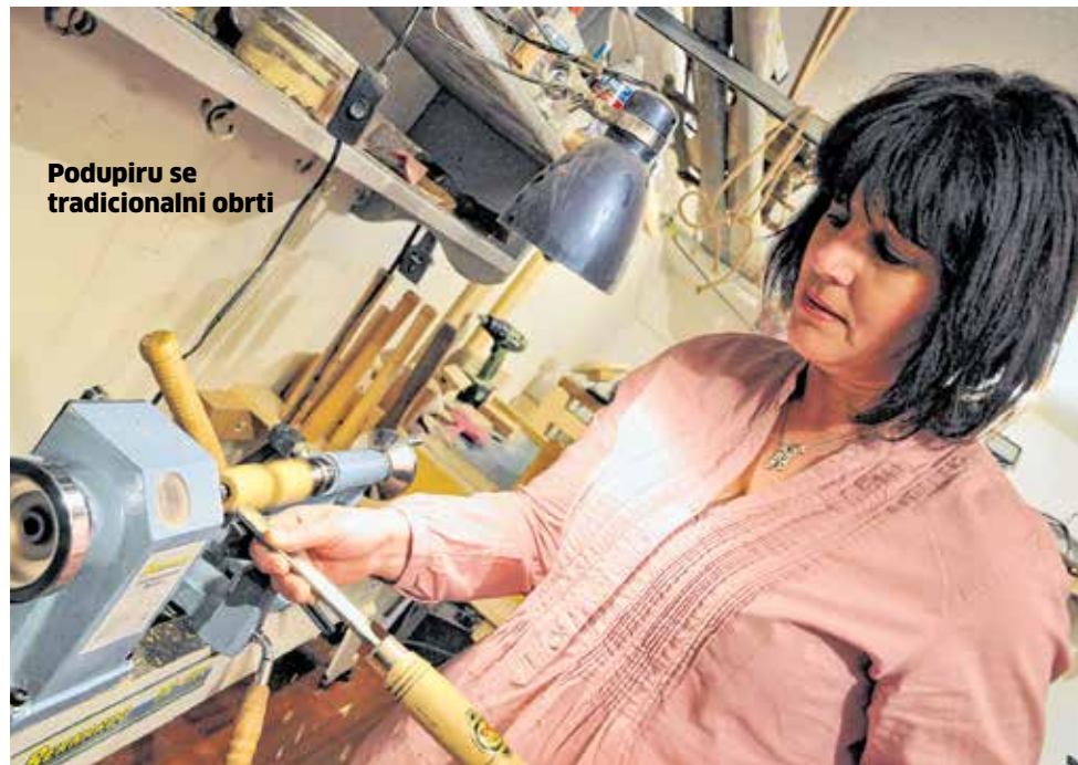
Podupiru se tradicionalni obrti

Sve to upućuje da od strane Županije postoji vizija malog i srednjeg gospodarstva koje treba biti konkurentno i ravnomjerno razvijeno, a koje se temelji na rastućem broju uspješnih poslovnih subjekata, kontinuiranom povećanju izvoza i povećanom broju zaposlenih. Zadarska županija će i dalje pronalaziti mogućnosti olakšanom pristupu financijskim instrumentima i raditi na što većoj promociji poduzetništva