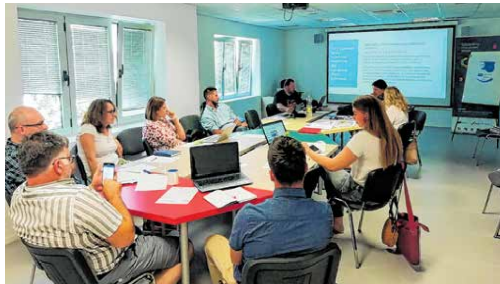
Održan je prvi radni sastanak hrvatskih projektnih partnera

Na prvom radnom sastanku projektni partneri su definirali i usuglasili provedbu aktivnosti projekta