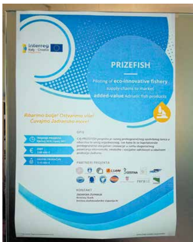
Plakat projekta Prizefish

Zadarska županija pomoći će oko uvođenja i primjene tržišnih inovacija na korist svih sudionika. Kroz projektne aktivnosti projekta PRIZEFISH provest će se revizija postojećeg stanja u sektoru ribarstva, marketinškog statusa morskih proizvoda kako bi se utemeljili novi elementi obrade proizvoda i njihove prezentacije potrošačima. Kroz primjenu novih metoda prerade morskih proizvoda i razvojem njihove marketinške prezentacije osigurat će se potencijal za izgradnju lanca eko-inovativnih proizvoda od morskih plodova. Koristi za Županiju kao javnom tijelu manifestirat će se u okviru širenja inovativnih znanja i ideja, edukacije dionika i koristi za izravne proizvođače i buduće potrošače.