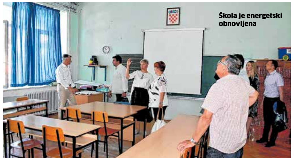
Škola je energetska obnovljena