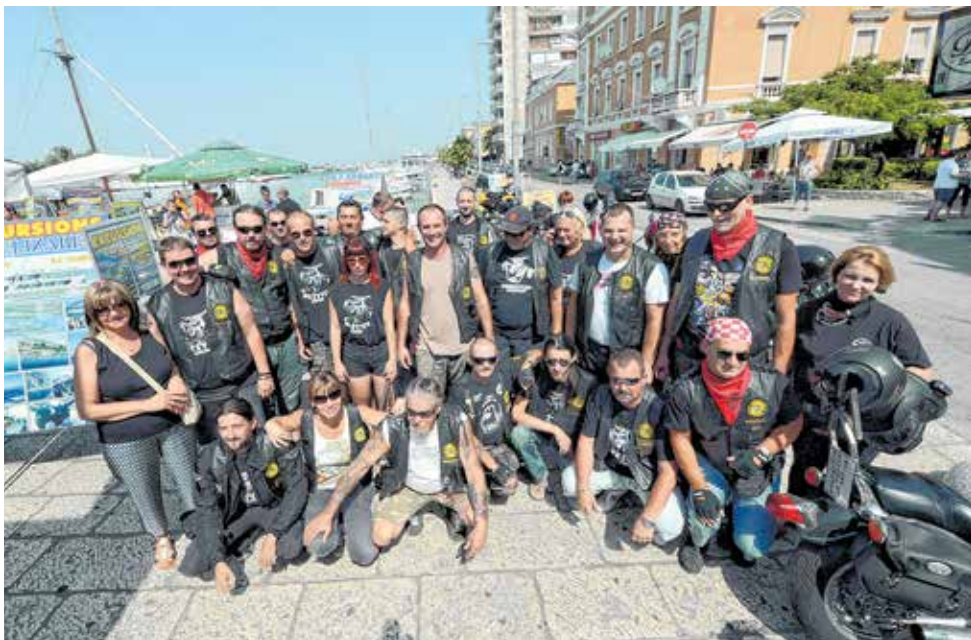
Beštije sudjeluju u brojnim humanitarnim akcijama