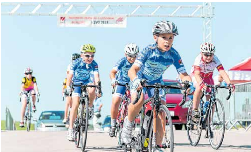
Sudjeluje i stotinjak biciklista