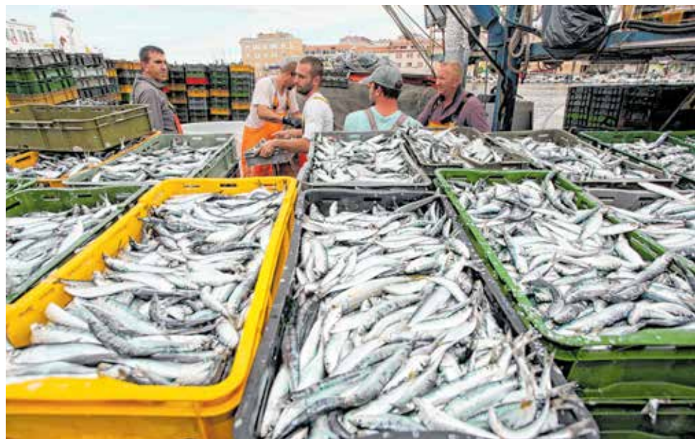
Jedan od ciljeva je i povećanje konkurentnosti jadranske ribarske industrije