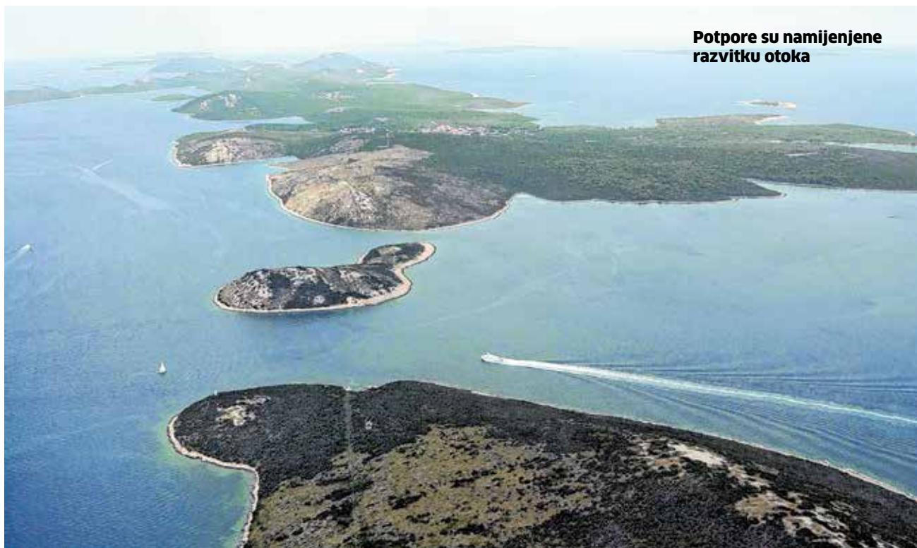
Potpore su namijenjene razvitku otoka

Tako je Zadarska županija prošle godine u sklopu aktivnosti potpore malom poduzetništvu svake godine dodjeljuje potpore malim poduzetnicima, a sve u cilju razvoja i jačanja konkurentnosti malog gospodarstva isplatila potporu u ukupnom iznosu od 400.000,00 kuna na račune 82 prijavitelja koji su ispunili tražene uvjete Javnog poziva za male poduzetnike