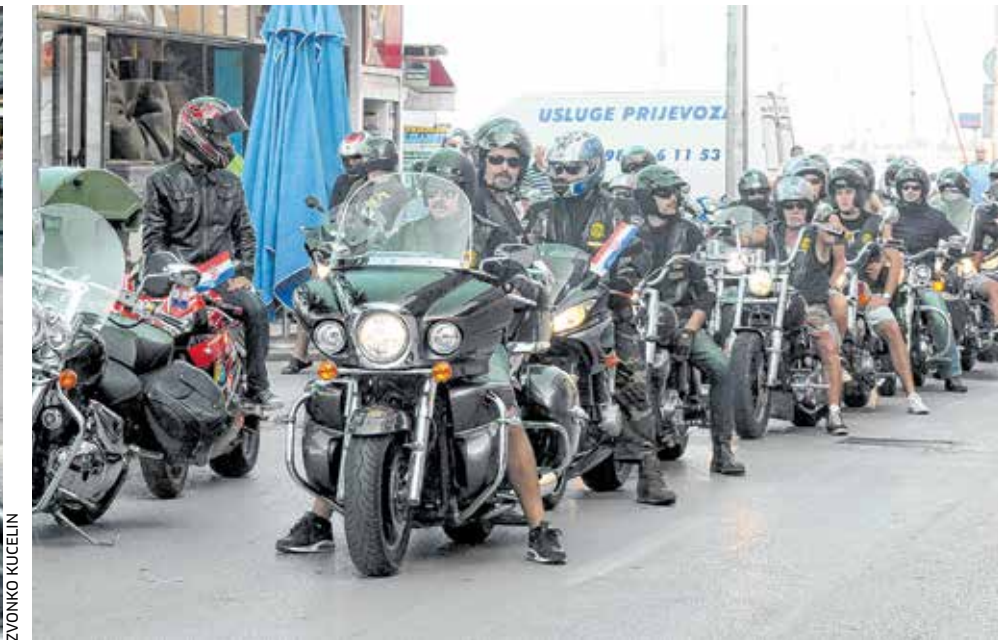
Moto defile od Branimira do Zvonimira u povodu Dana pobjede