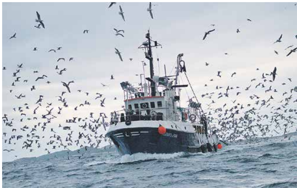
Kroz projektne aktivnosti provest će se revizija postojećeg stanja u sektoru ribarstva

PRIZEFISH »UPRAVLJANJE EKO-INOATIVNIM LANCIMA OPSKRBE U RIBARSTVU, KAKO BI SE POSTIGLA DODANA VRIJEDNOST JADRANSKIH RIBLJIH PROIZVODA«