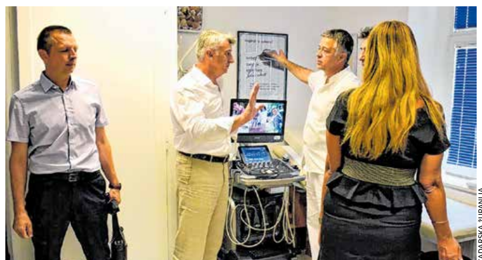
U Domu zdravlja župan je obišao ambulante koje su opremljene u sklopu projekta