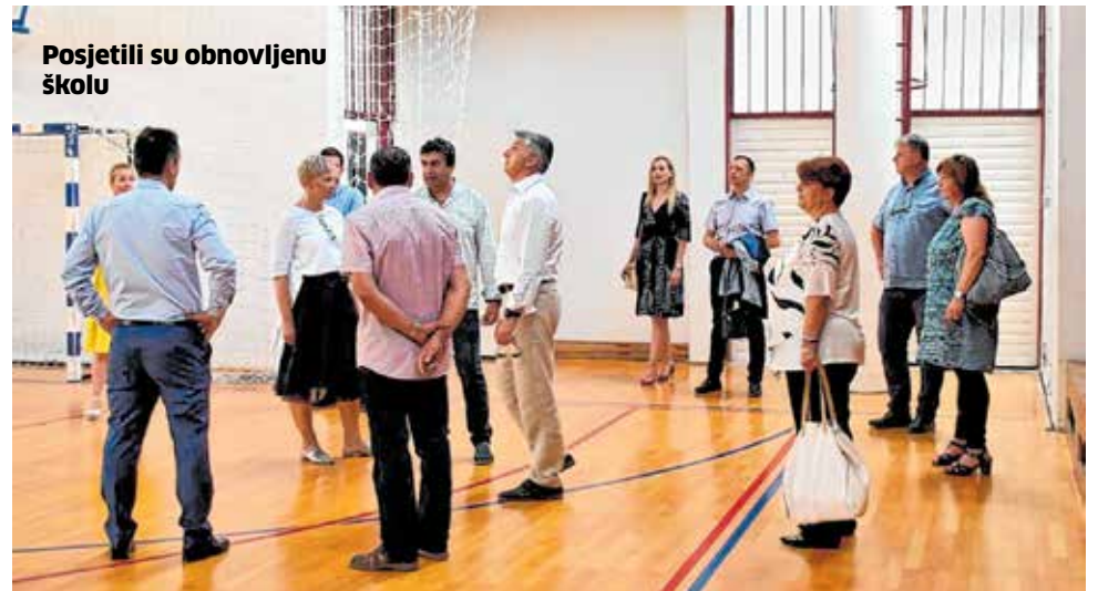
Posjetili su obnovljenu školu

- Županijska lučka uprava Zadar uložila je posljednjih godina značajna sredstva u sanaciju i rekonstrukciju brojnih mjesnih luka na području cijele naše županije, a u tom smjeru ćemo nastaviti i u narednom razdoblju. Luka Katine u Pagu jedan je od pravih primjera kvalitetne suradnje nas regionalne i lokalne razine te Ministarstva mora, prometa i infrastrukture koje je financijski podržalo ovaj projekt, istaknuo je Longin.