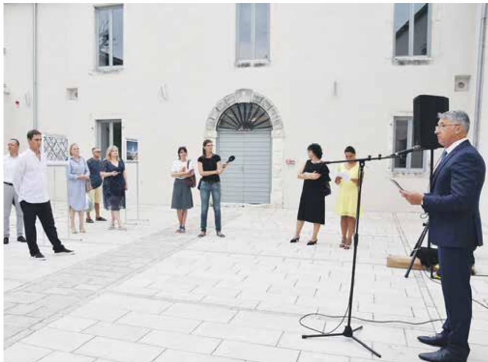
Sa svečanosti proglašenja najboljih