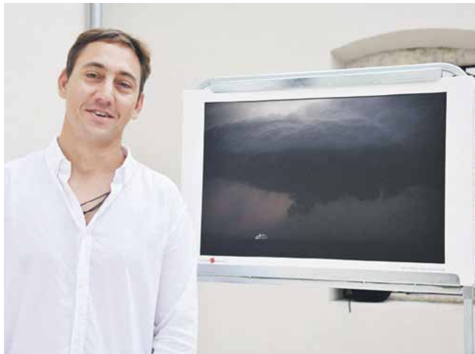
Nagrađeni sa pobjedničkom fotografijom

NATJEČAJ - VOLIM SVOJU ŽUPANIJU OVE GODINE SRUŠIO REKORD: