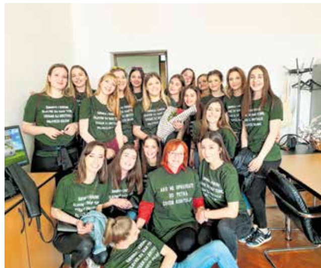
One će svijet učiniti - ljepšim!

vježbe iz primijenjene kozmetike, frizerstva i pedikerstva. Škola također raspolaže i praktikumom za vježbe iz kemije i kozmetologije,