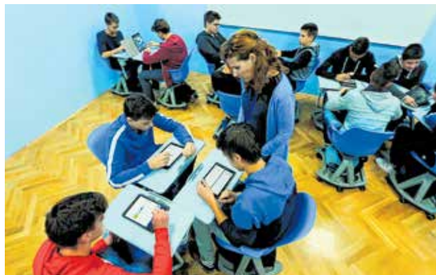
Osim predavanja, ima puno i radionica...