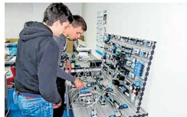
Teorija, pa praksa...