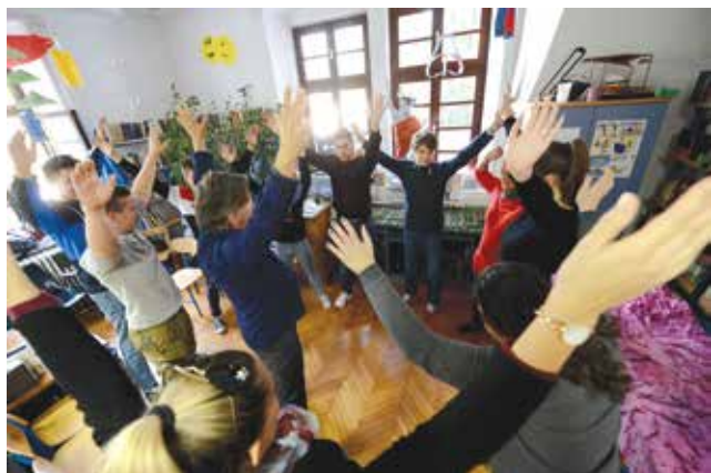
Veselo na školskim radionicama