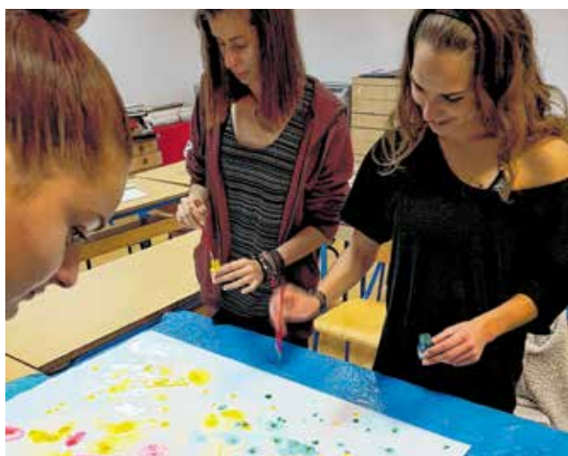
Radi se u manjim grupama

U odlučivanju o odabiru škole sudjeluju učenici i roditelji učenika završnih razreda osnovnih škola, a Škola primijenjene umjetnosti i dizajna obraća se svim učenicima završnih razreda osnovnih škola koji su stekli osnovne likovno umjetničke vještine i žele dalje nastaviti svoje obrazovanje u školi koja će ih poučavati i osposobiti za kreativno izražavanje i likovno umjetničke vještine te odabir željenog smjera - slikarski dizajner, grafički dizajner, fotografski dizajner, aranžersko - scenografski dizajner, dizajner odjeće i dizajner tekstila. Završetkom četverogodišnjeg obrazovanja u željenom smjeru nakon položene Državne mature imaju jednake mogućnosti za upis na željeni fakultet kao i svi ostali srednjoškolci, a ukoliko se odluče na rad nakon srednje škole mogu raditi u struci za koju su se obrazovali.