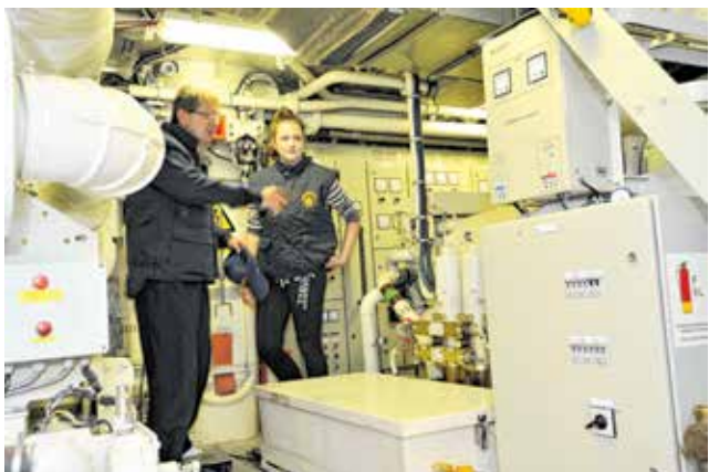
Budući strojari u svom ambijentu