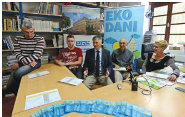
Eko dani u Prirodoslovno-grafičkoj školi