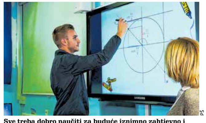
Sve treba dobro naučiti za buduće iznimno zahtjevno i odgovorno zanimanje