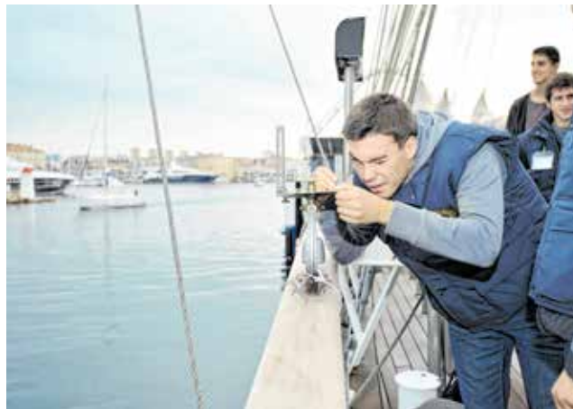
Praksa je - zakon!