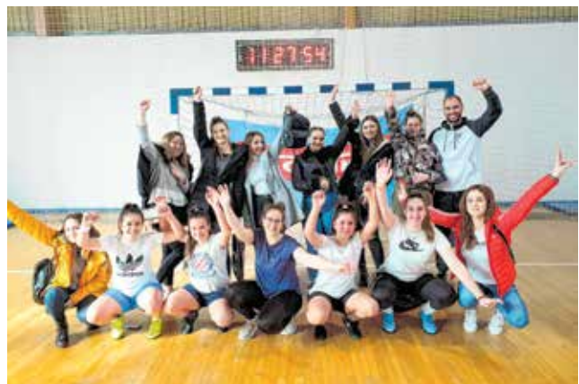
Djevojke se uspješno bave i futsalom