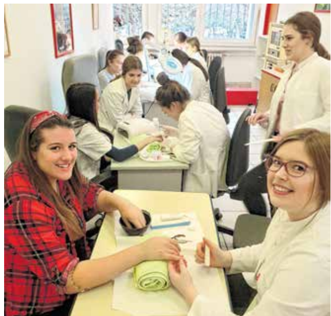
Praksa u školskom salonu