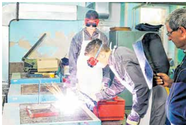
Znanje i spretne ruke pod budnim okom mentora

Nakon završetka školovanja, učenici Pomorske škole Zadar zapošljavaju se u domaćim i inozemnim broderskim kompanijama, charter firmama, putničkim lukama i lukama nautičkog turizma. Nekadašnji učenici Pomorske škole Zadar istaknuti su i cijenjeni pomorci i zapovjednici stranih i hrvatskih brodova, te direktori broderskih kompanija i luka