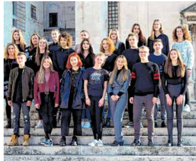
Sjajan je školski zbor

- Drage učenice i dragi učenici, naša škola vam pruža najbolje obrazovanje, a nastava se realizira sa svim potrebitim nastavnim sredstvima i pomagalicama. Zato dragi učenici, upišite se u našu školu gdje ćete dobiti kvalitetno znanje za upis na željeni studij - poručuju iz poznate zadarske Gimnazije Vladimira Nazora