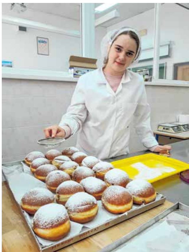
Krafne za prste polizat!

Agroturistički tehničar Poljoprivredni tehničar- fitofarmaceut Veterinarski tehničar Tehničar nutricionist Pekar Mesar Vrtlar Pomoćna zanimanja: cvjećar i pekar