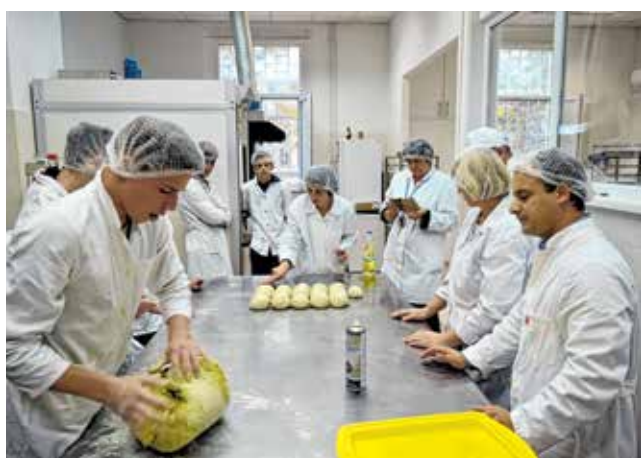
Obrazovanje za zanimanje - pekar

P oljoprivredna, prehrambena i veterinarska škola Stanka Ožanića djeluje preko 30 godina na području srednjoškolskog obrazovanja. Trenutno broji 322 učenika koje podučava 68 nastavnika i ostalog školskog osoblja.