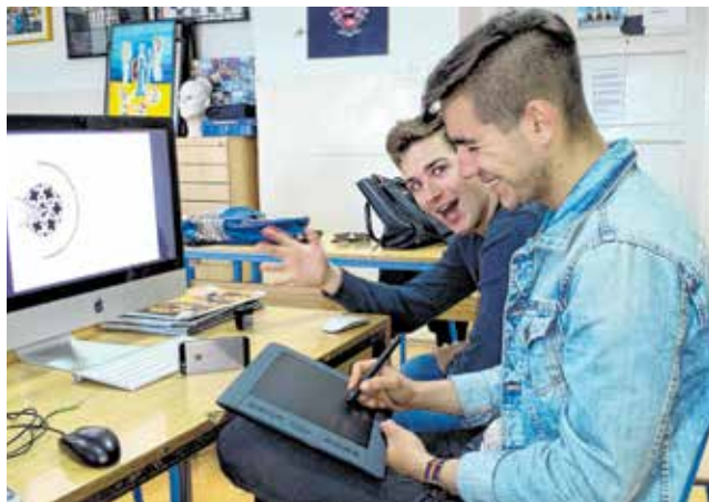
U školi je uvijek sjajna atmosfera...

Bez obzira na različite nazive smjerova u području likovne umjetnosti i dizajna, svi smjerovi jednako njeguju vizualni umjetnički izričaj i široki pogled na opću kulturu. Zahvaljujući manjem broju učenika po grupama, svakom se učeniku pristupa individualno i svaki učenik ostvaruje svoj profesionalni rast u skladu sa svojim posebnostima