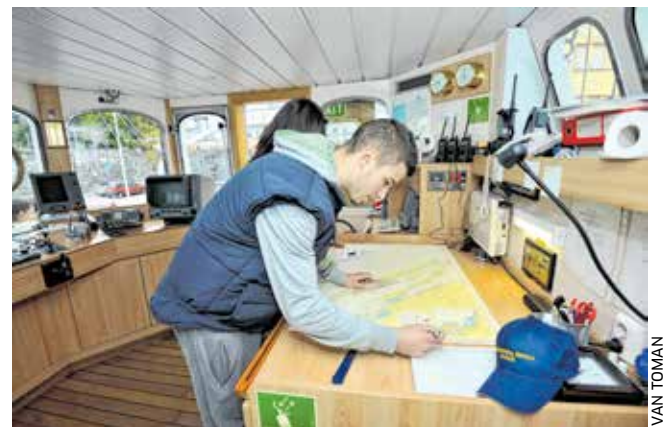
Karta se mora imati u »malom prstu«