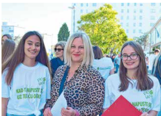
Suradnja profesora i učenika

Škola najzad postaje prava gospodarska škola kakva i priključuje Zadru i Zadarskoj županiji koja je prvenstveno, u komparativnom smislu, agroturistička županija. U velikoj i prelijepoj Zadarskoj županiji, školu vidimo kao primarnu uz perspektivu širenja djelatnosti i neprekidnog trajanja. Za pravo nam daju i najnovija razvrstavanja stručnih škola Hrvatske u 14 sektora, unutar kojih se u prvom sektoru nalaze upravo sve tri struke koje njeguje naša škola: poljodjelstvo, prehrana i veterina - naglasila je ravnateljica Poljoprivredne, prehrambene i veterinarske škole Stanka Ožanića Jelena Gulan.