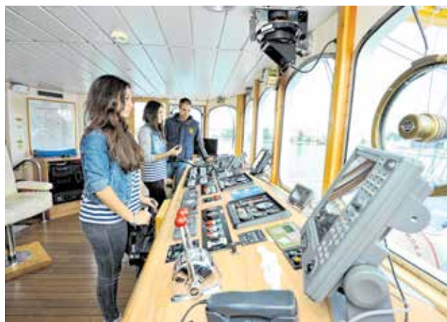
Sve je više i djevojaka u Pomorskoj školi