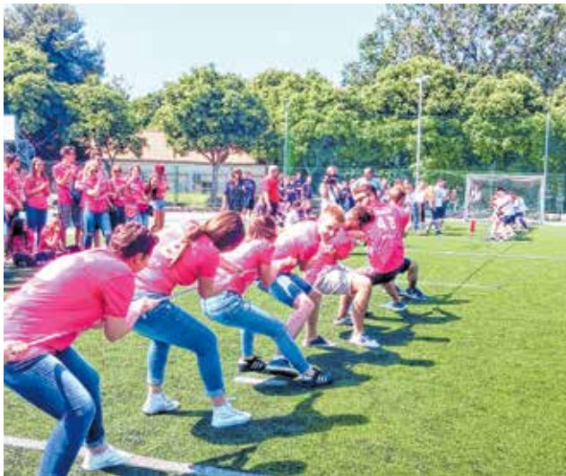
Maturanti na kraju školovanja - ludijada

- Drage učenice i dragi učenici, naša škola vam pruža najbolje obrazovanje, a nastava se realizira sa svim potrebitim nastavnim sredstvima i pomagalicama. Zato dragi učenici, upišite se u našu školu gdje ćete dobiti kvalitetno znanje za upis na željeni studij - poručuju iz poznate zadarske Gimnazije Vladimira Nazora