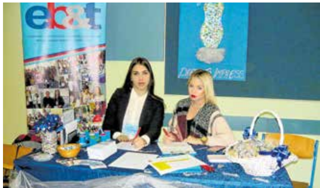
Učenici ove škole uspješni su na mnogim natjecanjima

U četverogodišnjem trajanju su programi - Ekonomist, Komercijalist, Poslovni tajnik i Upravni referent . Nakon završenog četverogodišnjeg srednjoškolskog obrazovanja polaznik se može zaposliti ili nastaviti školovanje na bilo kojem fakultetu prema vlastitoj želji. U trogodišnjem zanimanju nudi se program - Prodavač . Nakon završenog srednjoškolskog obrazovanja, polaznik je osposobljen za rad u području trgovine