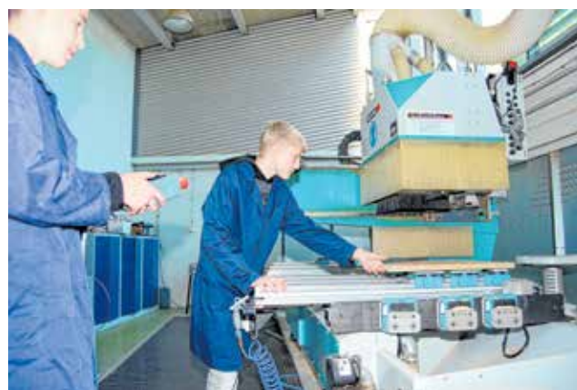
Vrijedno zanimanje - stolar