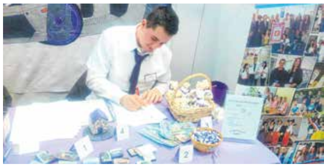
Kreativnost je njima svakodnevnica