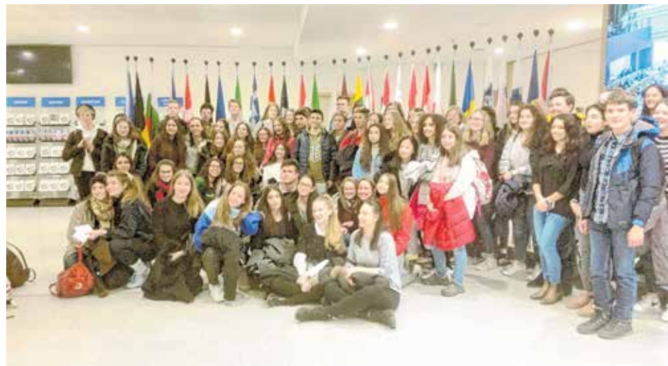
U Europskom parlamentu u Bruxellesu