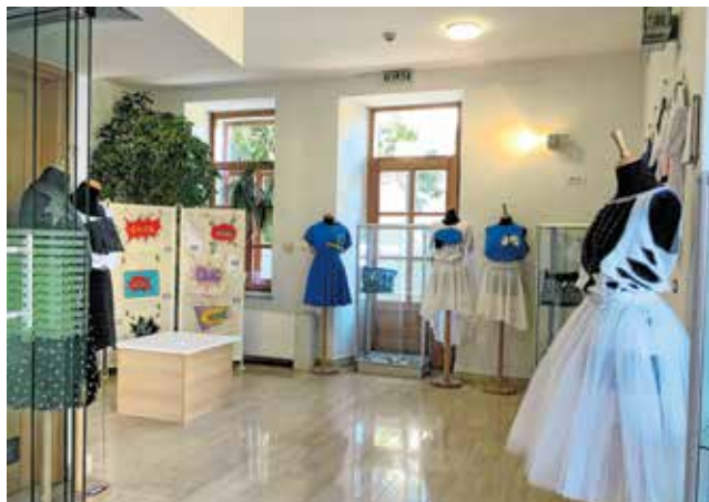
Ovako izgledaju hodnici ŠPUD-a, poput galerije