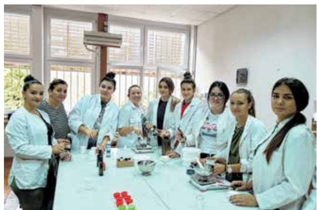
Uče se i osnove kozmetologije