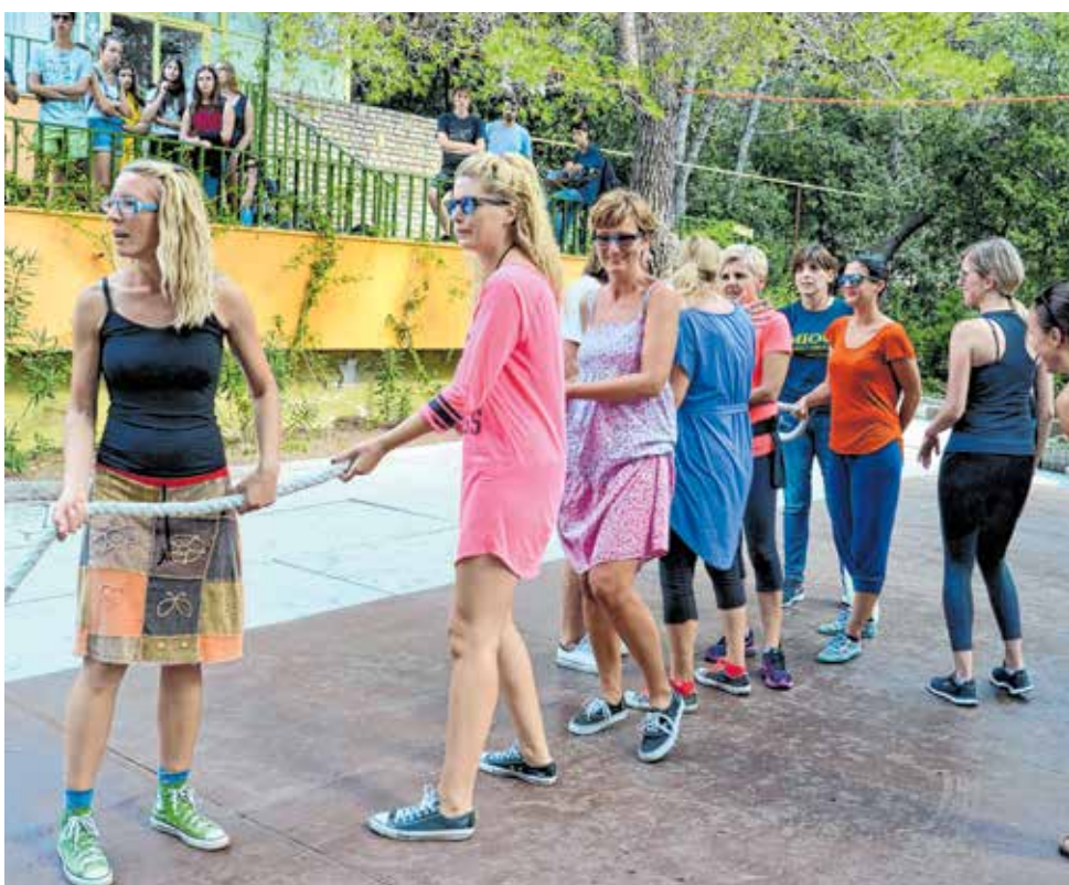
I profesori su »hrabri«...

smjera. Opći smjer obuhvaća uravnotežen odnos svih općeobrazovnih nastavnih predmeta u sklopu kojeg učenici odabiru drugi strani jezik (njemački ili talijanski - početnici ili nastavljači).