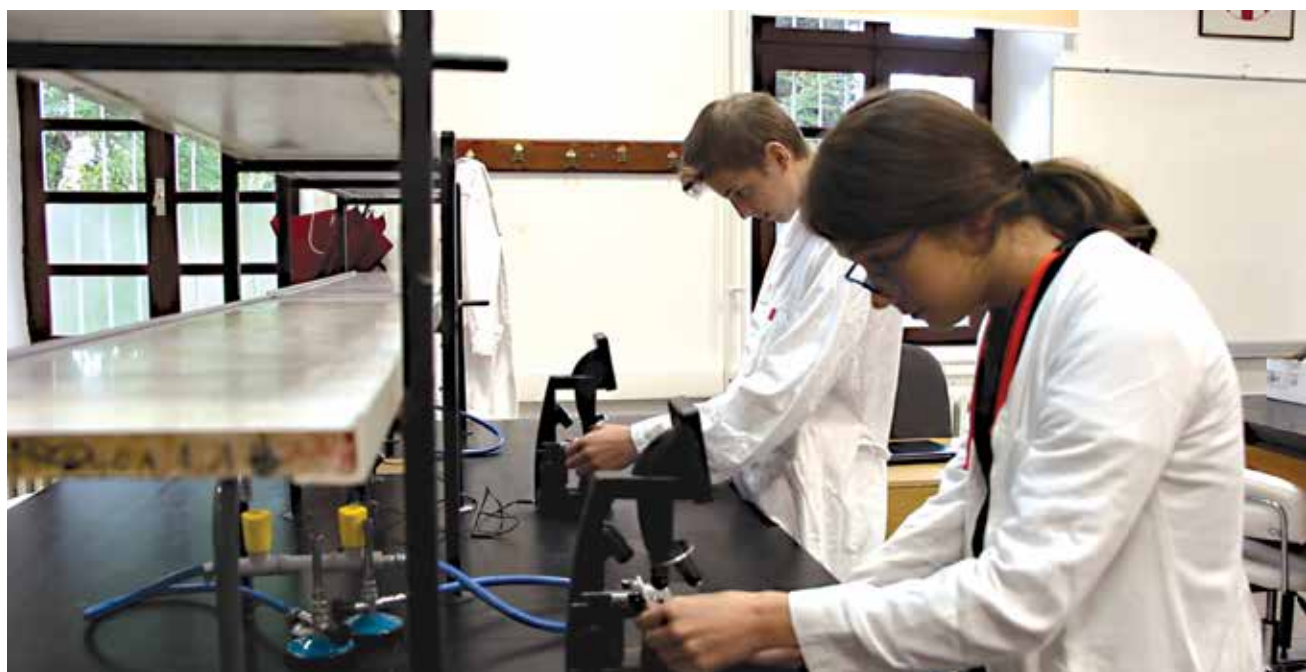
U školi su i dva laboratorija s najsuvremenijom opremom za kemiju