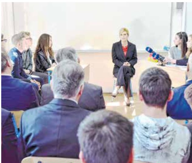
Debata s predsjednicom RH Kolindom Grabar Kitarović