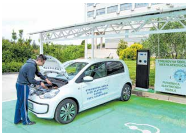
Električni automobil i punionica ispred škole

Trogodišnji programi su deficitarni, što potvrđuju i stipendije Ministarstva gospodarstva, te učenici Strukovne škole Vice Vlatkovića, odmah nakon završetka obrazovanja nalaze radno mjesto u svijetu rada. Prošle godine su imali situaciju da su se poduzetnici natjecali za