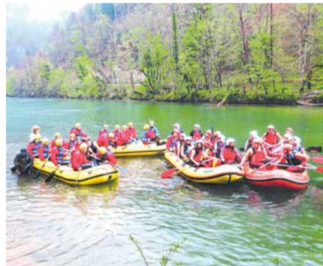
Nazorovci u Eko akciji i raftingu na Kupi