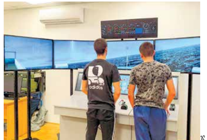
Simulatorom plove morima svijeta

Nakon završetka školovanja, učenici Pomorske škole Zadar zapošljavaju se u domaćim i inozemnim broderskim kompanijama, charter firmama, putničkim lukama i lukama nautičkog turizma. Nekadašnji učenici Pomorske škole Zadar istaknuti su i cijenjeni pomorci i zapovjednici stranih i hrvatskih brodova, te direktori broderskih kompanija i luka