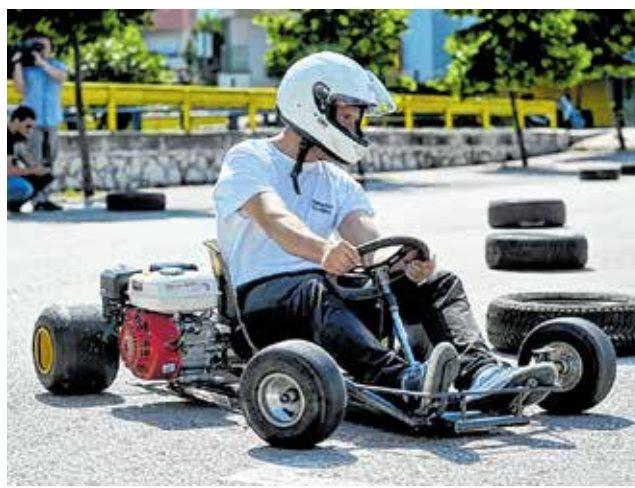
Karting staza ispred škole

pojedine učenike ove škole u trogodišnjim programima.