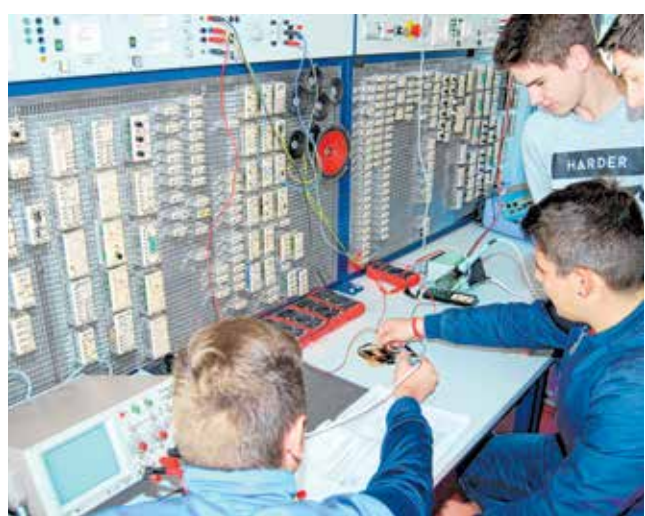
Dobra praksa i zajednički rad zlata vrijedi

Strukovna škola Vice Vlatkovića imenovana je Regionalnim centrom kompetentnosti u strojarstvu te će već ove godine započeti s opremanjem i nabavom nove opreme vrijedne desetke milijuna kuna što samo za sebe govori o mogućnostima koje će moći pružiti svojim učenicima kao što je - robotika i automatizacija, industrija 4.0 i CNC strojevi, mehatronika, automehatronika, kućne instalacije i još puno, puno toga