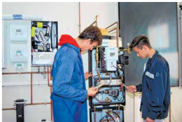
Puno je kabela i žica, ali oni sve znaju...