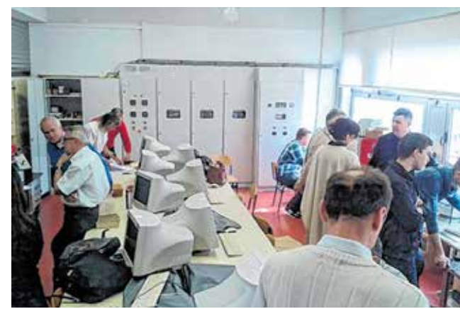
Škola 21. stoljeća