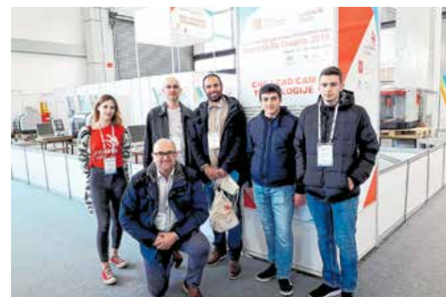
Učenici sudjeluju na mnogim natjecanjima