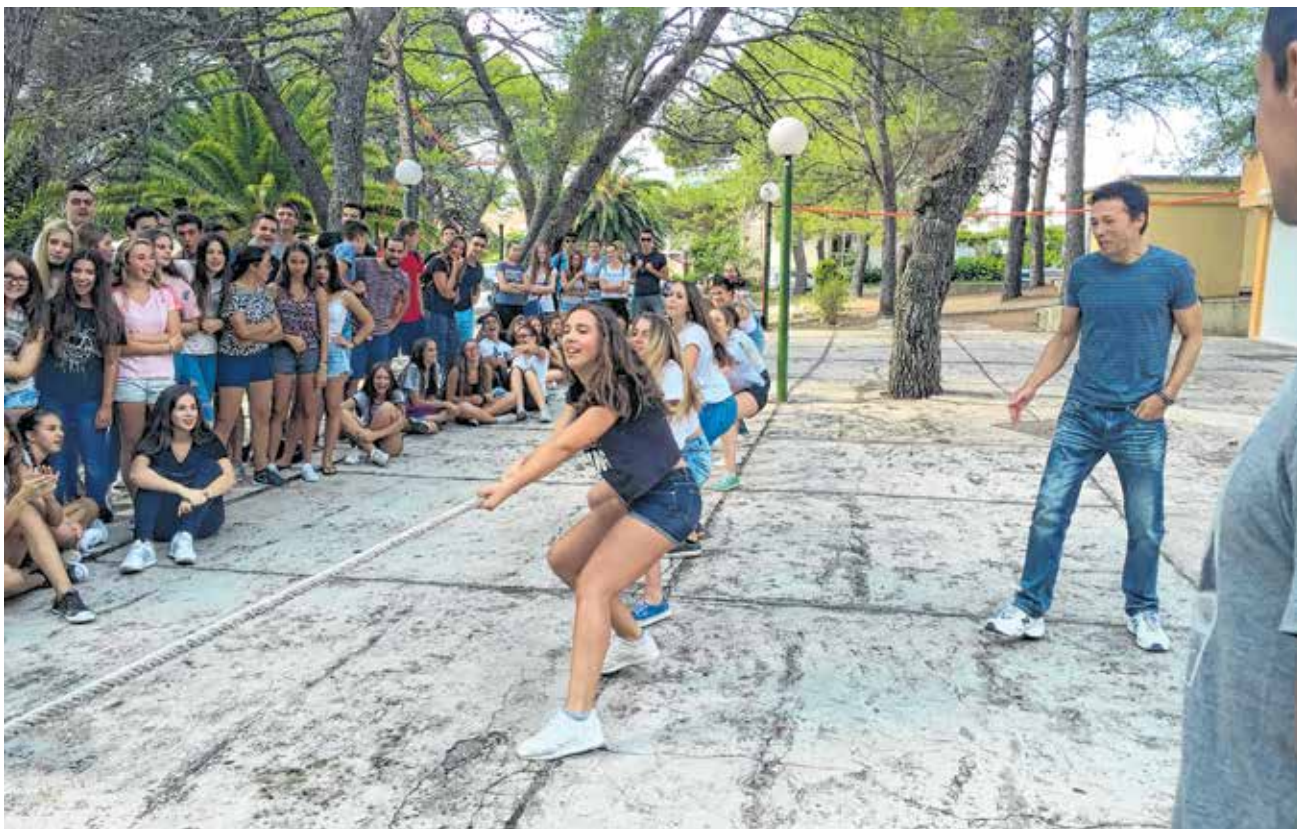
Druženje u Kukljici

Pored temeljne zadaće svake, pa i ove Gimnazije da pripremimo mlade ljude za nastavak školovanja na fakultetima i visokim učilištima, nastoje ne zapostaviti ni druga područja koja su interesantna mladim ljudima kao što su sport, glazba, projekti, putovanja. Tako učenici imaju priliku izraziti svoje dodatne interese putem brojnih izvannastavnih aktivnosti: Eko-grupa, Kreativna likovna radionica, Školski pjevački zbor, Prva pomoć, Volonterski klub, Mladi knjižničari, Projekt Građanin, Školski sportski klub... Škola drugu godinu provodi Erasmus+K1 projekt »Samopouzdanje darovitih učenika« čiji je jedan od ciljeva razvoj kompetencija nastavnika kako bi u svoju nastavu implementirali suvremene strategije i metode učenja. Od ove godine kreću s još jednim Erasmus projektom »Eksperimentiranje, kreativnost i inovativnost u učenju znanosti«. Kada je riječ o njegovanju duha zajedništva, ono na što su posebno ponosni je Humanitarni koncert koji organiziraju svake godine u svibnju i na kojem nastupaju učenici i (hrabri) nastavnici.