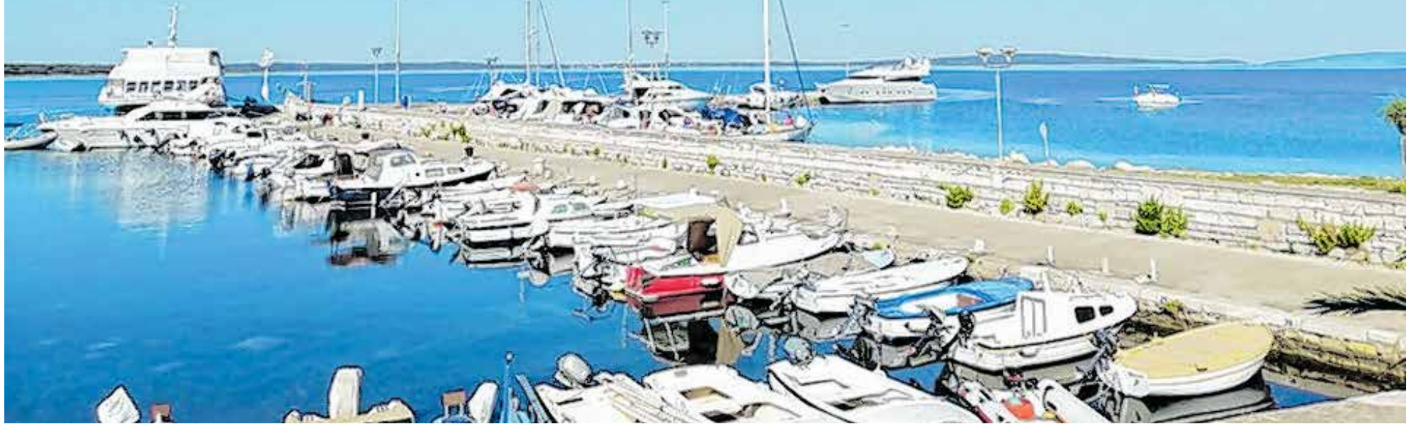
Vodovodizacija će dodatno potaknuti razvoj turizma na otocima (na slici Olib)

Naši otoci su naš biser i izgradnja vodovoda pridonijet će kvaliteti života svih stanovnika i njihovom ostanku na otoku, ali i dodatnom razvoju turizma, kazao je župan Božidar Longin