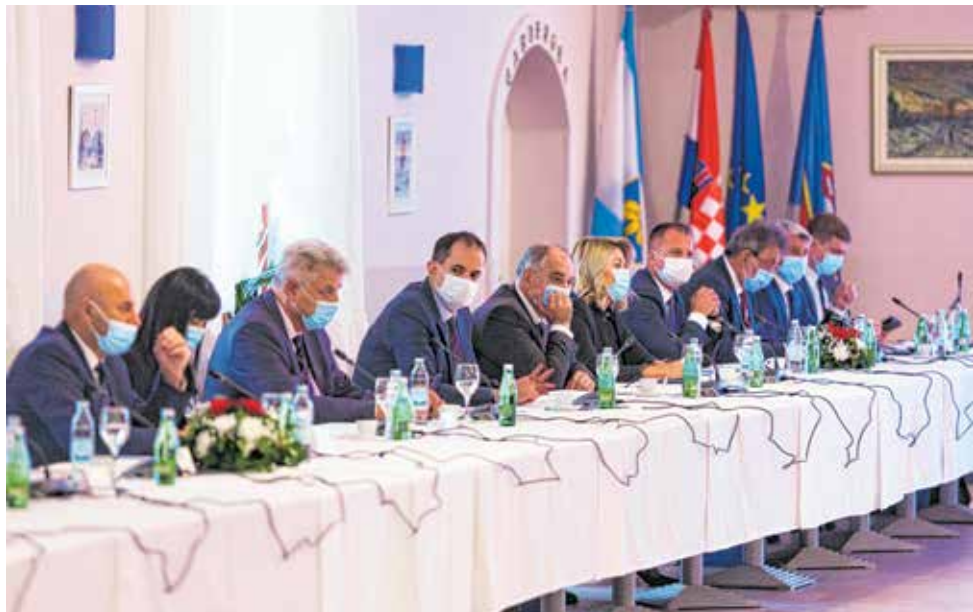
Tema sastanka bila je reforma lokalne samouprave, korištenje europskih fondova i gospodarski oporavak