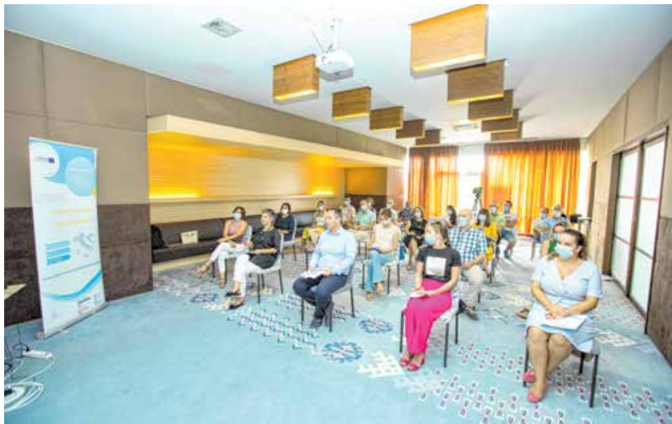
Održan seminar za podizanje svijesti – testiranje pilot područja (umjetni riblji greben)

SmArtFish« financira se iz programa Interreg V-A Italija – Hrvatska, njegova je provedba započela 1. siječnja 2019. godine i trajat će do 30. lipnja 2021. godine. Opći cilj projekta je jačanje uloge priobalnog ribolova na području GSA 17 (sjeverni i srednji Jadran) i to u skoroj budućnosti potičući inovacije unutar konteksta »plavog rasta« kroz usvajanje pristupa upravljanja temeljenog na ekosustavu. Vodeći partner projekta je talijanska regija Veneto, a jedan od partnera na projektu je Zadarska županija.