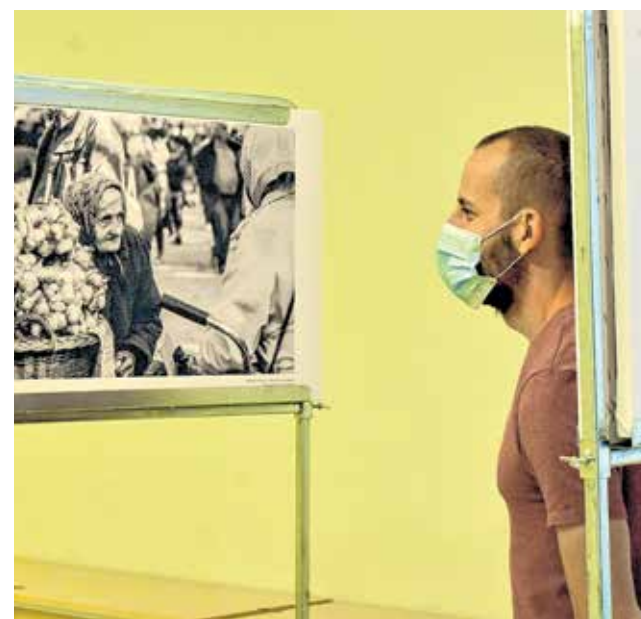
Zadranima su do 18. rujna mogli razgledati fotografije s motivima raznih hrvatskih županija

Izložba je, inače, bila otvorena do 18. rujna.