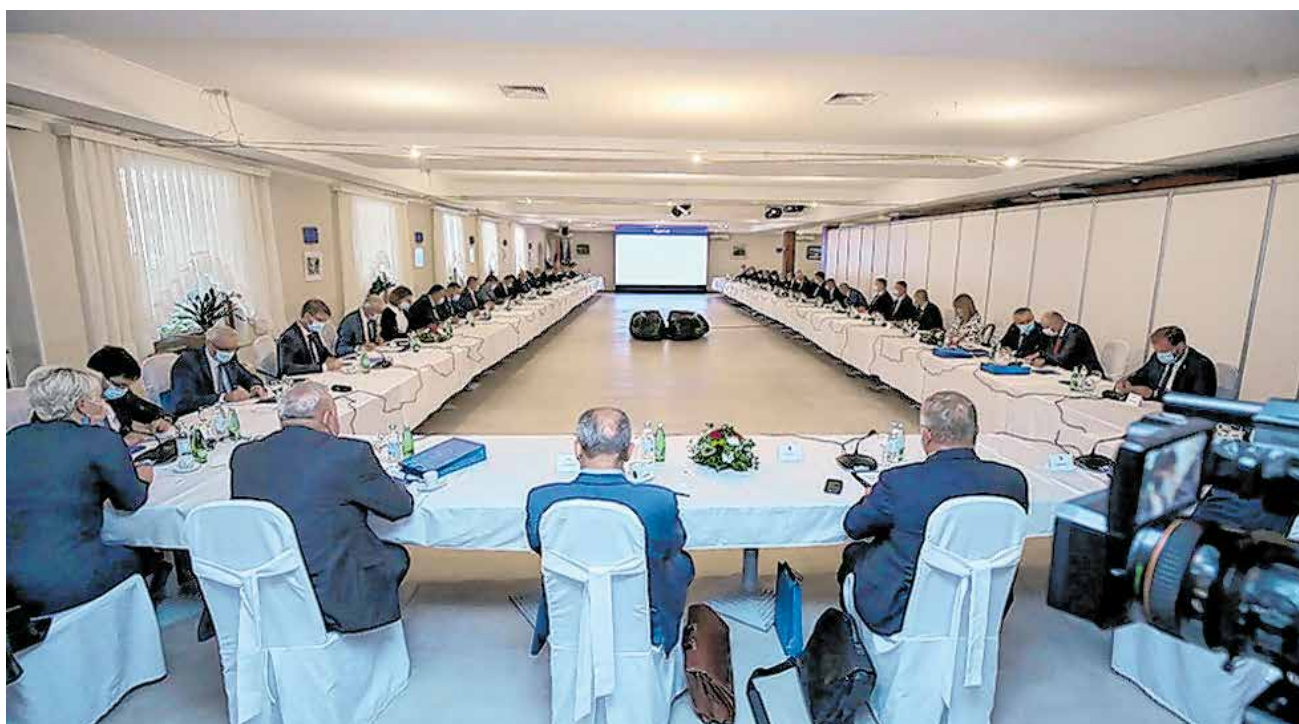
Osmi sastanak Vlade sa županima, predstavnicima Udruge gradova u RH i Hrvatske zajednice općina

- Do 15. rujna 2020. ovjeren je 27,4 milijarde kuna, plaćeno 33,1 milijarde kuna, a ugovoreno 83,5 milijardi kuna iz EU fondova, čime je Republika Hrvatska peta na razini EU, istaknula je na sastanku ministrica regionalnog razvoja i fondova EU Nataša Tramišak. S obzirom na to da u trenutnom financijskom razdoblju ne postoji program koji ciljno rješava specifične probleme na lokalnoj i regionalnoj razini, predstavljen je integrirani teritorijalni program koji integrira razvojne prioritete općina, gradova, županija, zajednicu više županija ili funkcionalnih regija s pripadajućim nacionalnim prioritetima, pritom uzimajući u obzir njihove specifičnosti. Unutar tog programa će se programirati zasebni prioriteti za svaku od NUTS 2 regija kao i njima pripadajuća sredstva.