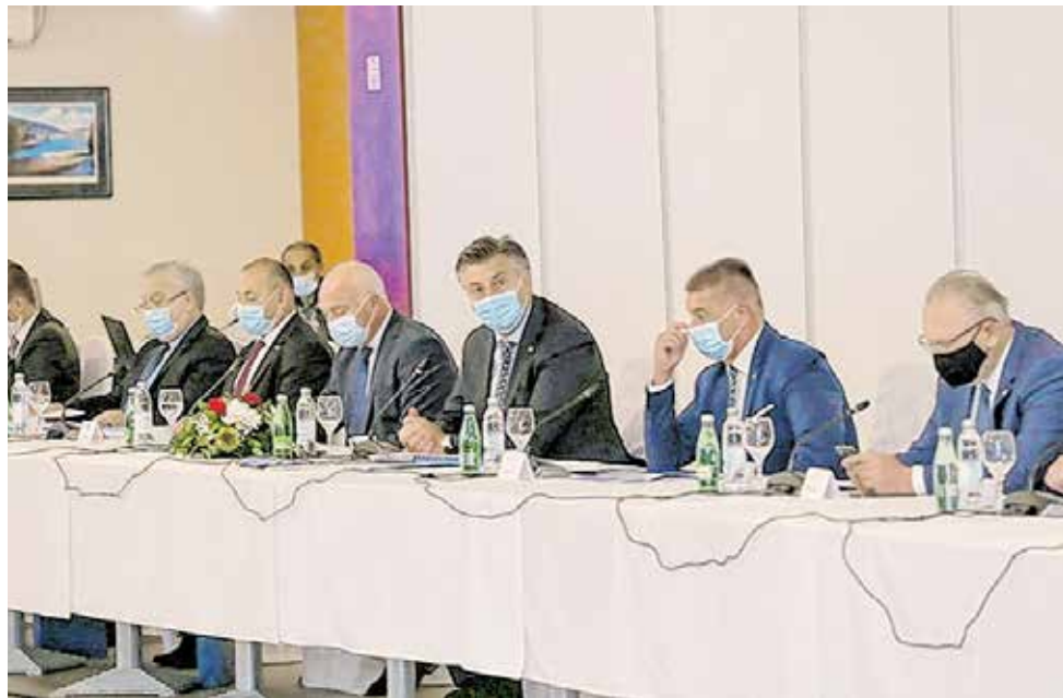
Premijer Plenković istaknuo je nužnost nastavka rada na funkcionalnoj decentralizaciji

U GOSPIĆU Održan osmi sastanak Vlade sa županima