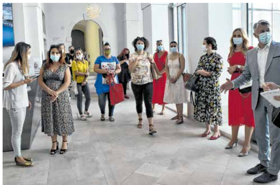
I ove godine u Zadru je gostovala putujuća izložba s najuspješnijim fotografijama s foto-natječaja »Volim svoju županiju«