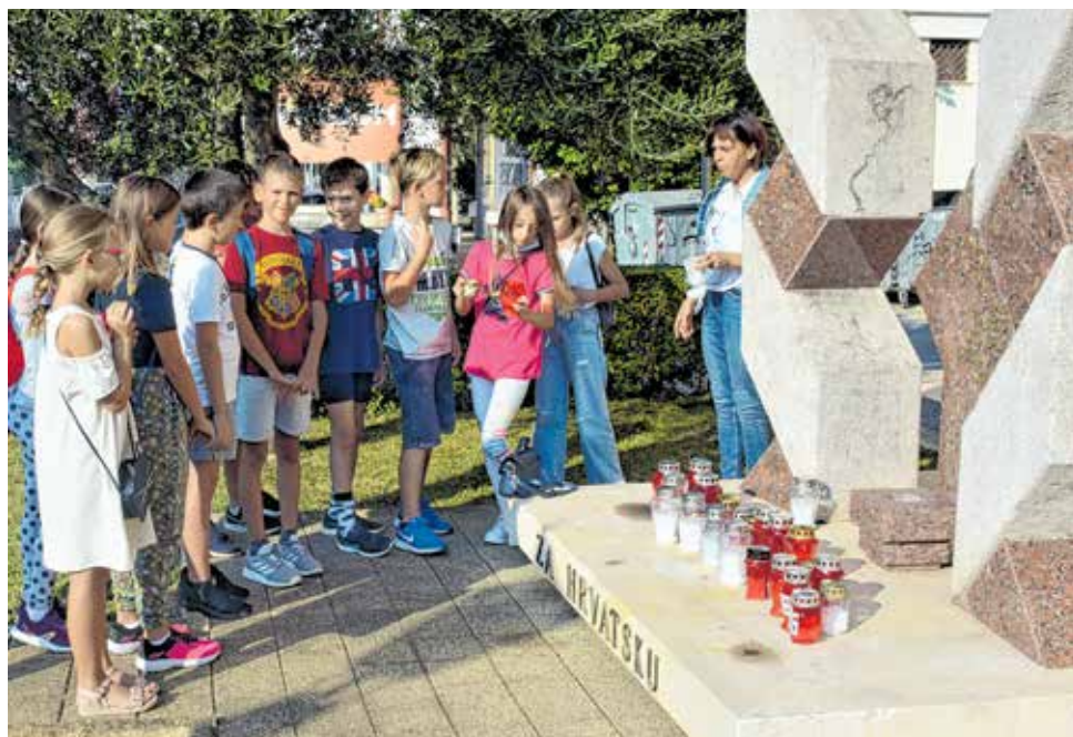
Poginulim hrvatskim braniteljima i civilima počast su odali učenici OŠ Sukošan i Područne škole Debeljak

- Zadarska županija sa 300 tisuća kuna sufinancira adaptaciju škole u Debeljaku, dok je za vrtić u Gorici uložila 100 tisuća kuna, rekao je Šime Vicković, te izrazio uvjerenje da će se uskoro potpisati ugovori za strateške projekte aglomeracije Bibinje-Sukošan, te Biograd-Pašman i Preko-Kali.