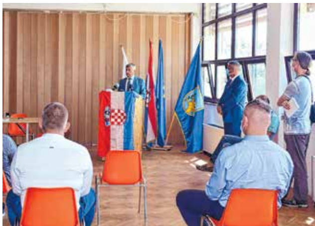
Sva naša mjesta moraju dobiti vodu i priključak na odvodnju, istaknuo je zadarski župan

o sporazumu o sufinanciranju projekta »Izrada studijske dokumentacije za izgradnju vodno-komunalne infrastrukture aglomeracija Karinskog i Novigradskog mora«, čija je ukupna vrijednost 2.986.000 kuna bez PDV-a, PDV iznosi 746.500, a ukupna cijena s PDV-om iznosi 3.732.500 kuna.