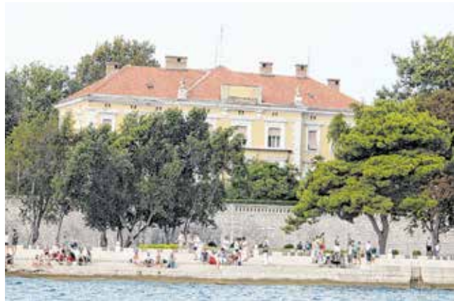
Zamjenici će se birati samo u velikim gradovima s preko 35.000 stanovnika i u županijama

najboljim rješenjima u borbi protiv gospodarske i zdravstvene krize. Mjere koje smo donosili, a koje su morale biti usklađene sa svakom našom županijom, uzimajući u obzir sve naše specifičnosti, bile su veliki izazov. Ključno je da smo, kao i do sada, djelovali simultano, efikasno i racionalno, rekao je župan šibensko-kninski Goran Pauk. Na sastanku se raspravljalo