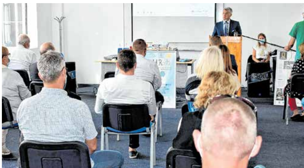
Nositelj projekta je Zadarska županija, a partneri gradovi Benkovac, Nin i Pag te Zavičajni muzej Benkovac

Projektna dokumentacija za sve planirane objekte je spremna i čekaju se novi natječaji za prijavu na izgradnju.