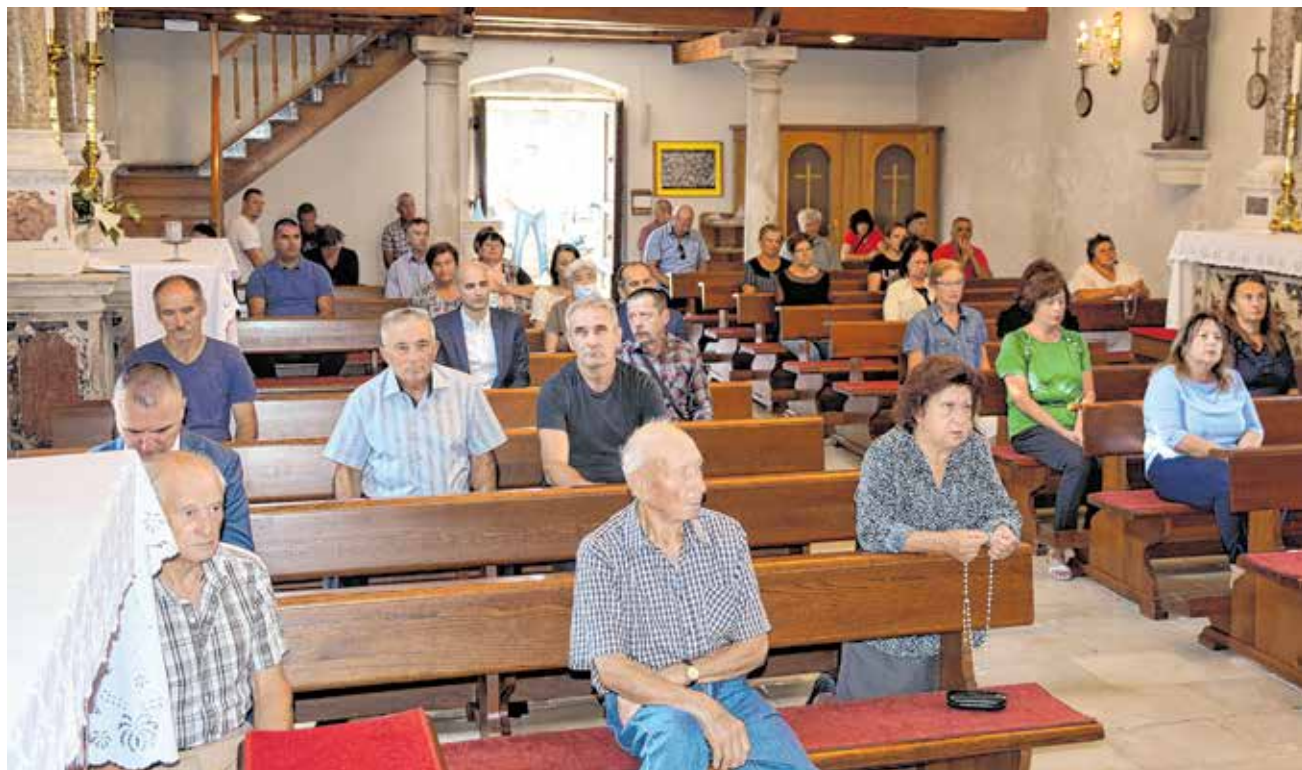
Svečano obilježen Dan općine Sukošan 18. rujna