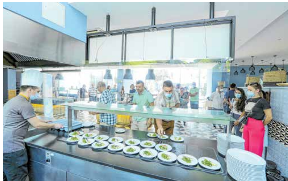
Kako se fileтира i priprema riba?