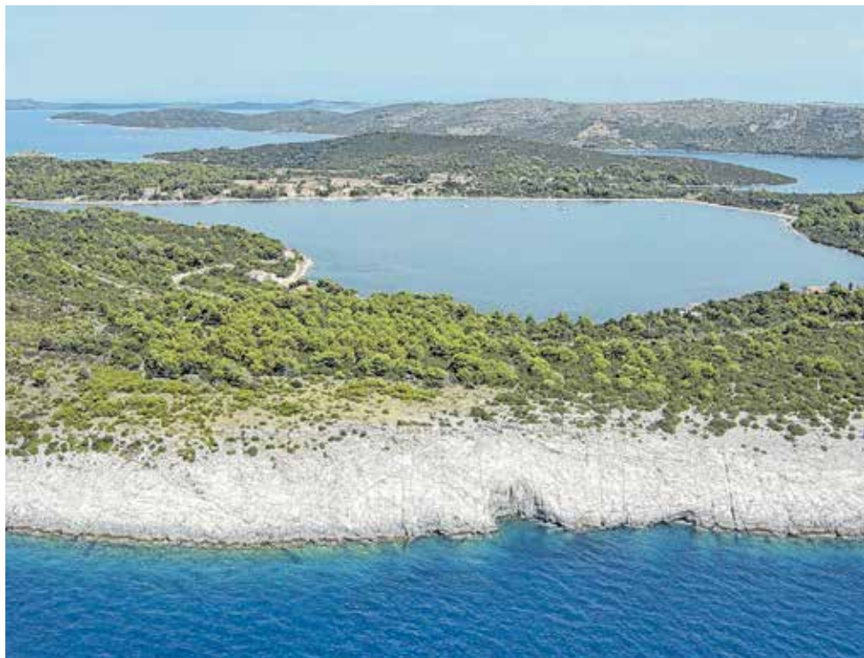
Izgradnja vodovodne mreže za cjelokupan drugi prsten zadarskih otoka uključuje i Dugi otok (na slici Veli rat)

Na sastanku je utvrđen i precizan vremenski plan aktivnosti koje bi trebale dovesti da se projekt financira iz narednog programskog razdoblja Europske unije od 2021. - 2027. godine.