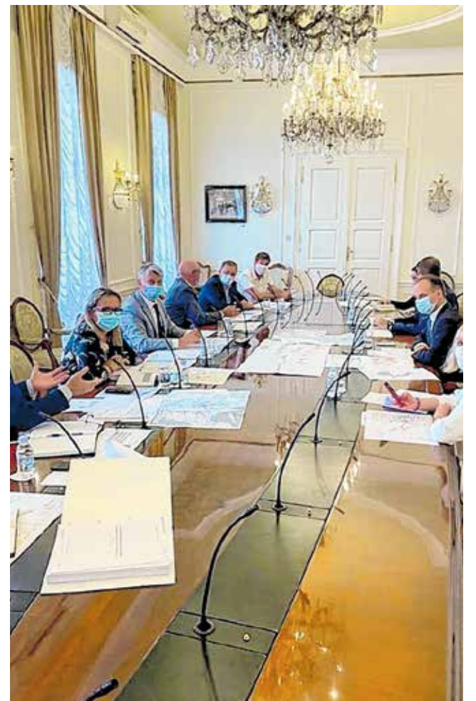
Na sastanku u Vladi dogovoren je nastavak izrade preostale projektno-tehničke dokumentacije

Na sastanku u Zagrebu dogovoreno je kako će glavni