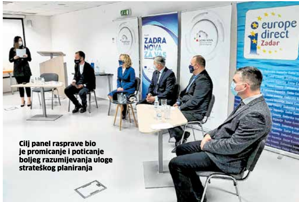
Cilj panel rasprave bio je promicanje i poticanje boljeg razumijevanja uloge strateškog planiranja

ZADRA NOVA PANEL RASPRAVA »VAŽNOST STRATEŠKOG PLANIRANJA - PRILIKE I IZAZOVI«