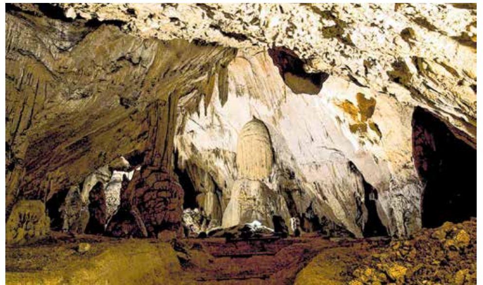
Cerovačke špilje su najveći špiljski kompleks u Hrvatskoj

Projekt Centar izvrsnosti Cerovačke špilje – održivo upravljanje prirodnom baštinom i krškim podzemljem (kao dio programa SPARC - Speleološki park Crnopac) odobren je za financiranje u sklopu poziva Promicanje održivog korištenja prirodne baštine u nacionalnim parkovima i parkovima prirode (referentni broj: KK.06.1.2.01) u sklopu OP Konkurentnost i kohezija 2014. - 2020. Ukupna vrijednost projekta iznosi 68.453.850,00 kuna, a dovršetak se očekuje do kraja 2021. godine.