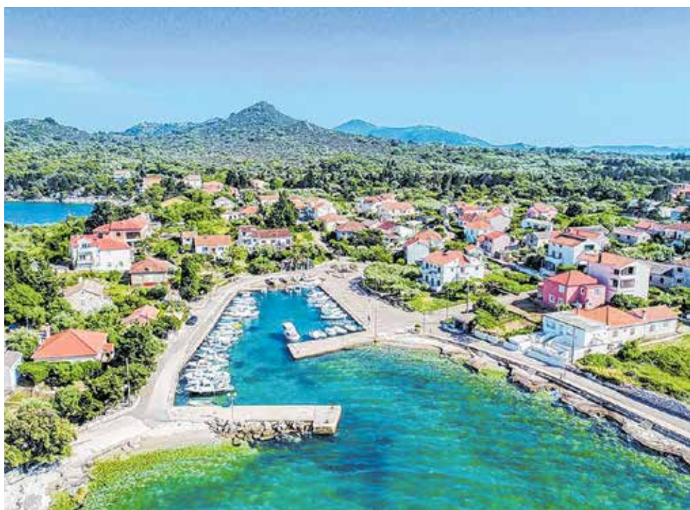
Sanirat će se obalni zidovi u luci Ugljan Čeprijanda

Prvu i drugu fazu uređenja obalnog pojasa od Sportskog centra do Rive financirala je Općina Sukošan. Za treću fazu, sanaciju obale od Rive do Keranovog mula na Ždralcu koja je unutar lučkog područja, investitor je Županijska lučka uprava Zadar koja je radila i projektnu dokumentaciju. Procijenjena vrijednost projekta iznosi 9.334.000 kuna.