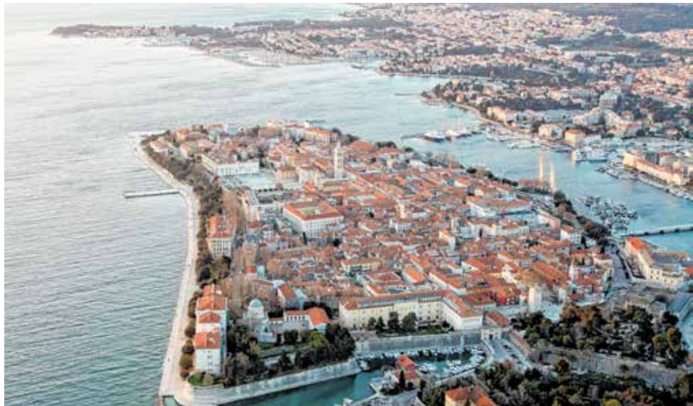
»Budućnost Zadarske županije kakvu želimo«, naziv je upitnika o potrebama i razvojnim prioritetima gradova i općina Zadarske županije