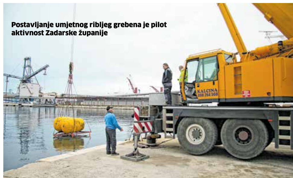
Postavljanje umjetnog ribljevog grebena je pilot aktivnost Zadarske županije

Nakon procesa uranjanja i tegljenja, preostaje jedino pričekati i provjeriti je li ova vezanija i itekako korisna instalacija kamen-temeljac za širenje gospodarskih aktivnosti u malom priobalnom ribolovu.