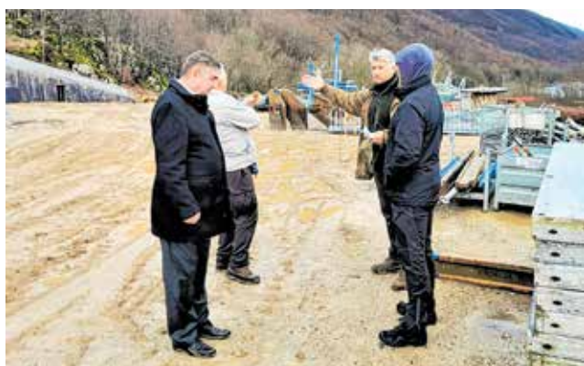
Kako napreduju radovi na vrijednom projektu?