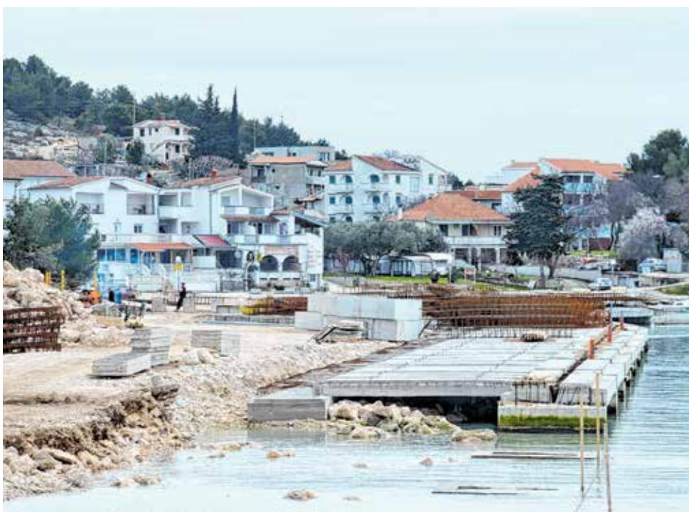
Uređenje obalnog pojasa luka Drage Dugovača

- Izgradnja obalnog zida za komunalni dio luke proteže se u duljini 280 metara,