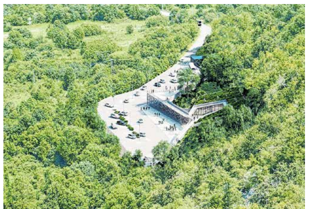
Projekt, vrijedan 68,5 milijuna kuna, provodi se na području Općine Gračac

Uloga Zadarske županije u projektu je kroz aktivnosti promidžbe i vidljivosti projekta prezentirati vrijednost i ulogu zaštićenog područja Parka prirode Velebit, s posebnim naglaskom na lokalitet Cerovačkih špilja, čime će se osigurati privlačenje broja posjetitelja i postaviti temelj komunikacijskog modela prema općoj i stručnoj javnosti.