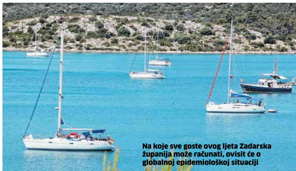
Na koje sve goste ovog ljeta Zadarska županija može računati, ovisit će o globalnoj epidemiološkoj situaciji

Zato cjepivo ima izuzetno značenje za nas. Ako se cijepljenje na vrijeme obavi turistička sezona bi mogla biti izuzetno dobra - možda i puno bolja nego se očekuje. Budući da smo od Slovenije, Austrije, Mađarske, Njemačke, Italije, Češke, Slovačke i Poljske vremenski udaljeni najviše jedan dan vožnje automobilom, a da su mediteranske i ostale turističke »avio-destinacije« zbog pandemije prestale biti poželjne, bit će dovoljno samo otvoriti granice za nesmetani promet putnika kako bi mnogi od njih ponovno pohrlili na Jadran.