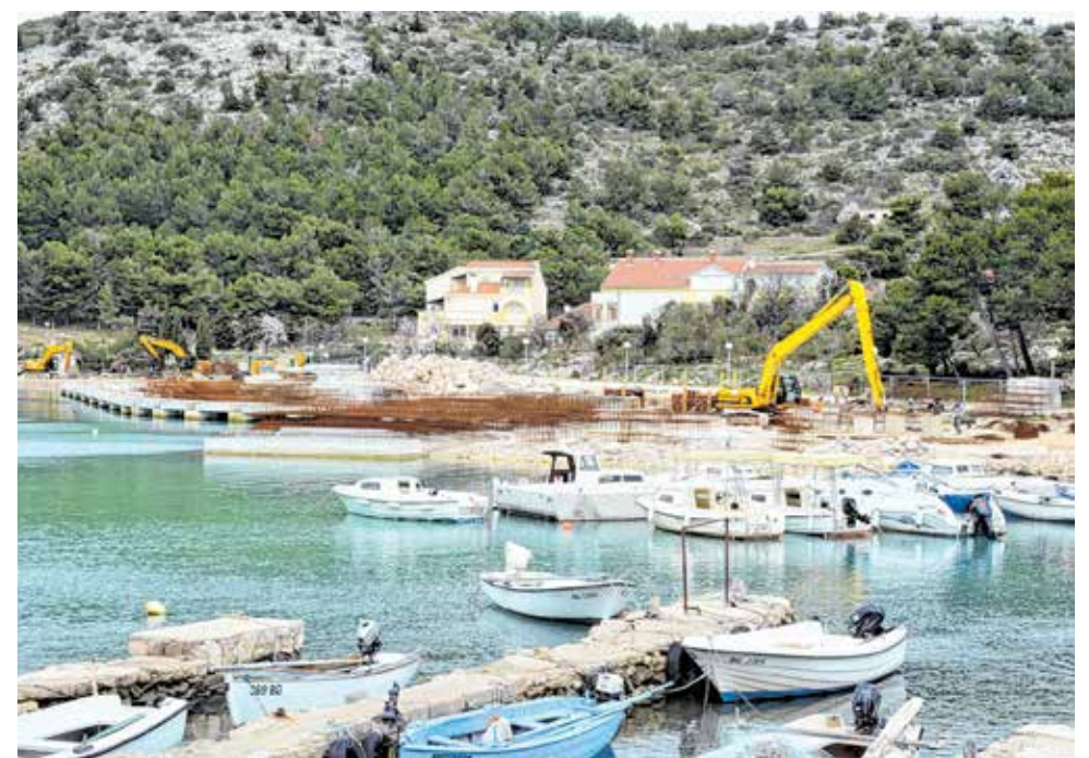
Radovi u luci Drage Dugovača, započeli su početkom 2020. godine, a vrijednost projekta iznosi 24,6 milijuna kuna