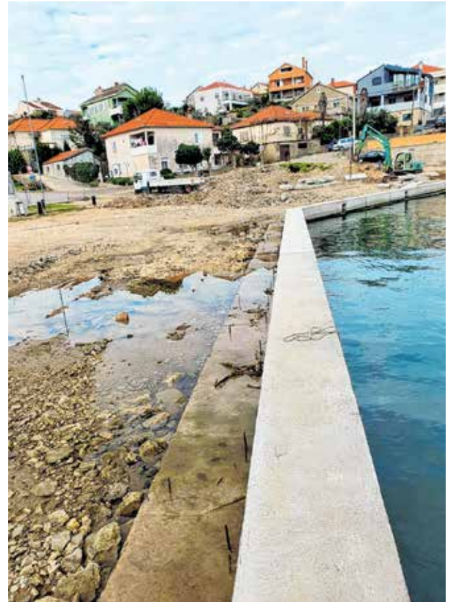
U sklopu projekta »Izgradnja rotora u uvali Batalaža u Kalima« radi se i novi obalni zid

- Uređenje obalnih zidova i lukobrana bilo je neophodno kako bi se poboljšala sigurnost korištenja komunalnih vezova u luci i operativne obale. Procijenjena vrijednost nabave je 1.912.500 kuna, zaključio je Davor Škibola.