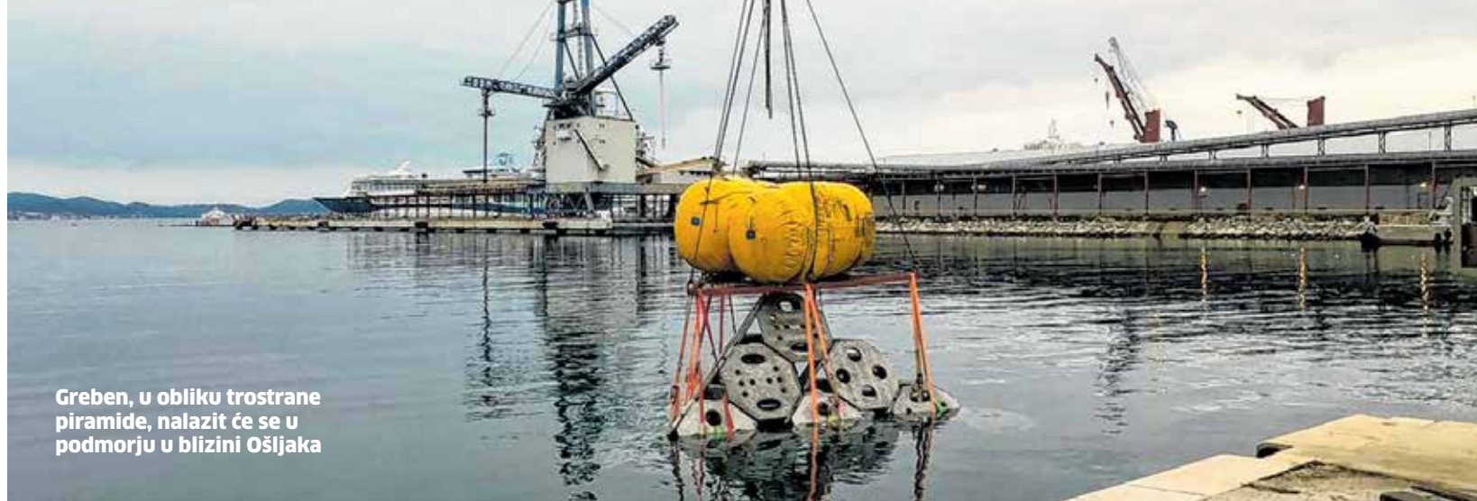
Greben, u obliku trostrane piramide, nalazit će se u podmorju u blizini Ošljaka

Ovaj umjetni riblji greben prvi je u Hrvatskoj i to nas čini uistinu ponosnima, posebice zbog toga što Zadarska županija nosi epitet »najribarskije županije.« Projektom Adri.SmArtFish uspjeti smo preskočiti administrativne barijere koje su dosad postojale za postavljanje umjetnog grebena, ističe Daniel Segarić, pročelnik županijskog Upravnog odjela za poljoprivredu, ribarstvo, vodno gospodarstvo, ruralni i otočni razvoj