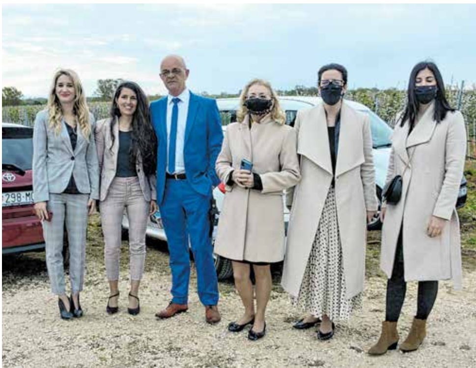
Stručni tim Agencije Zadra Nova

- Često govorimo da je to ključan preduvjet za dodatni razvoj poljoprivrede na ovom području. Naime, sustav navodnjavanja će dati sveži zamah poljoprivredi u Ravnim kotarima koja se posljednjih godina značajno razvija. Uz tri sustava navodnjavanja dovršetkom projekta Vransko polje 1. faza imat ćemo pokrivenu poljoprivrednu površinu od 2,5 tisuće hektara ukupne vrijednosti 330 milijuna kuna. Tada možemo govoriti o pravim preduvjetima za ozbiljniju poljoprivrednu proizvodnju, rekao je tom prigodom župan Longin.