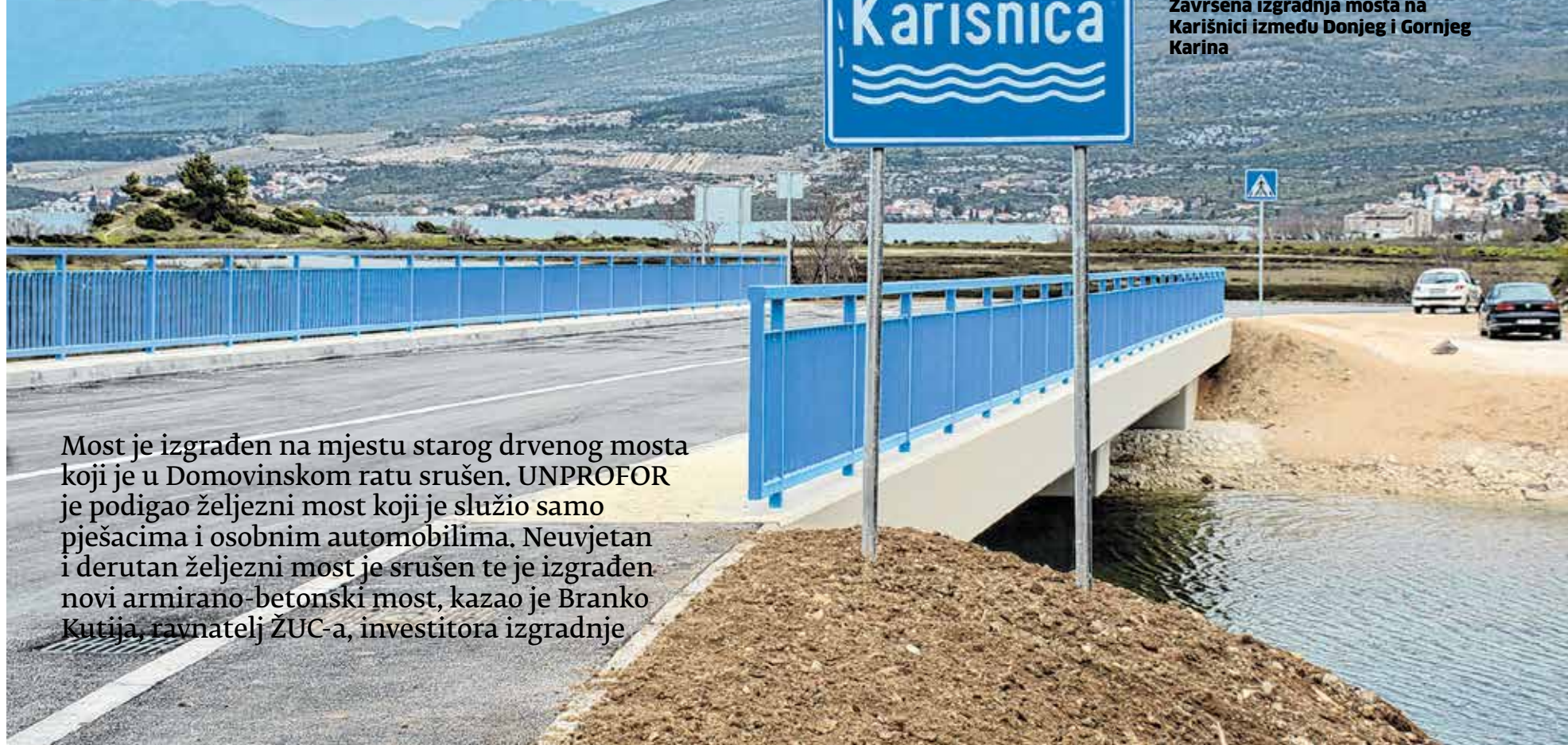
Završena izgradnja mosta na Karišnici između Donjeg i Gornjeg Karina