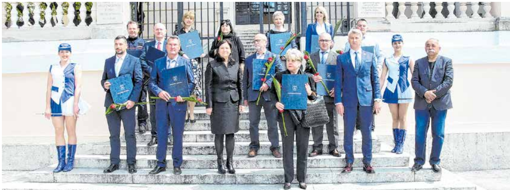
Laureati za 2020. godinu

Za 2020. godinu godišnju nagradu dobili su: Cromaris d.d., KUD Ivan Goran Kovačić Bibinje - ženska klapa Garofuli, Opća bolnica Zadar, OŠ Jurja Dalmatinca Pag, Otočni sabor, Služba civilne zaštite Zadar, Udruga dragovoljaca i branitelja Domovinskog rata 112. brigade, Udruga proizvođača pašskog sira otoka Paga, Udruga studenata Bukovice i Kotara i Zavod za javno zdravstvo Zadra.