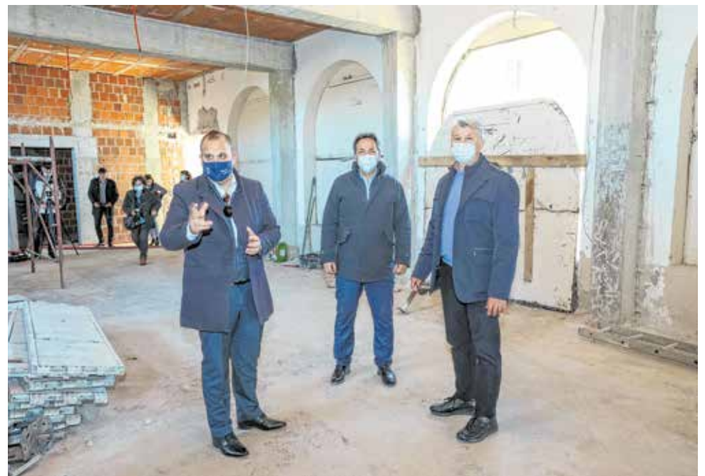
Gradilište novog hotela u Preku