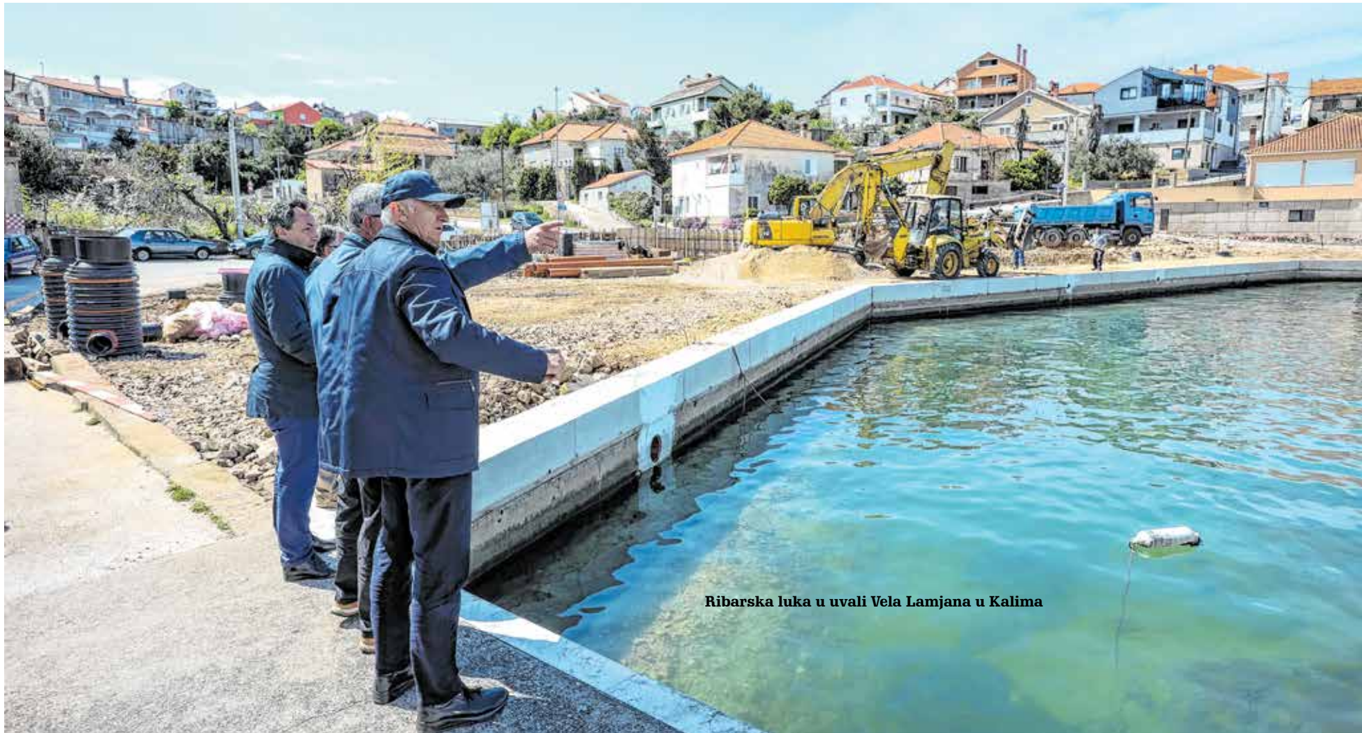
Ribarska luka u uvali Vela Lamjana u Kalima

Zahvaljujući kvalitetnoj suradnji nacionalne i regionalne razine, i to korišten izravan, pozitivan utjecaj na povećanje životnog standarda, depopulaciju i sm