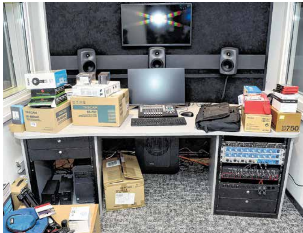
Korisnicima će na raspolaganju biti brojna i raznovrsna oprema