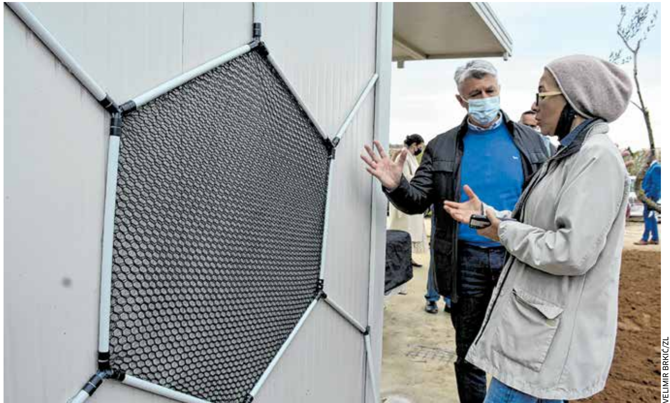
Kako djeluje sustav za prikupljanje vlage iz zraka?

- Temelji se na apsorpciji vode iz zraka i njenoj pohrani. Voda je svuda oko nas pa i u zraku te se na jedan metar četvorni metar može sakupiti i 50 litara vode.