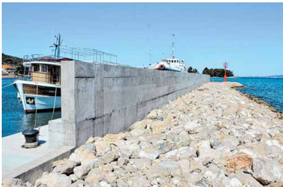
Nova školjera i zid u luci Mrljane

- Od kapitalnih i značajnih projekata u 2021. godini su Arca Adriatica, interpretacijski centar pomorske baštine, očuvanje kulturne baštine (Veliki tor Ugrinić, utvrda Pustograd, zvonik župne crkve), niskonaponska mreža i javna rasvjeta od Poljane do FKK Sovinje, uređenje Sridnje Đige i parapeta Ugrinić, plaža Studenac, mobilno reciklažno dvorište, početak