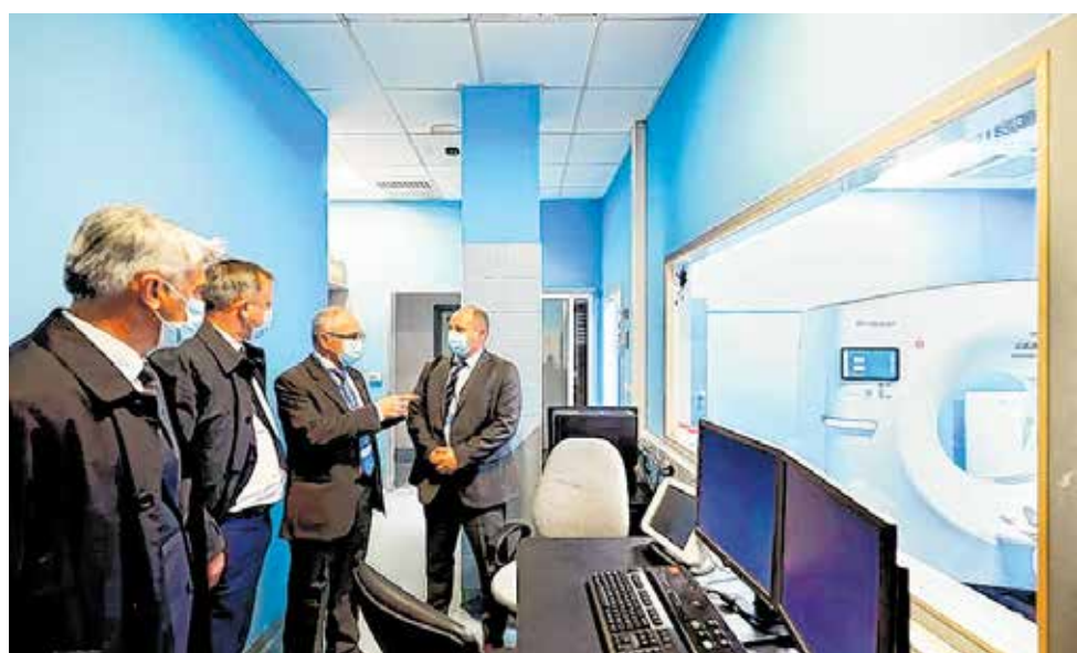
Obilazak novog CT uređaja vrijednog 5,5 milijuna kuna

Ugodno sam iznenađen postignutim napretkom i kvalitetom usluge koju pruža Opća bolnica Zadar. Bolnica je ostvarila značajan iskorak u posljednjih nekoliko godina, pogotovo s novom opremom koja podiže kvalitetu pružanja zdravstvenih usluga, kazao je državni tajnik u ministarstvu zdravstva Silvio Bašić