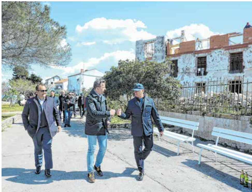
U Preku se gradi boutique hotel s četiri zvjezdice