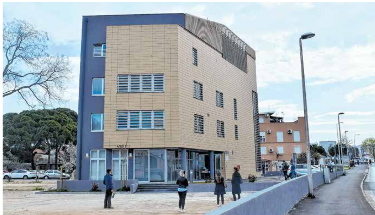
Centar za kreativne industrije na Relji

Iako je zgrada naizgled dovršena, još nije obavljen tehnički pregled te ishodena uporabna dozvola, pa su gosti i novinari zgradu obišli u zaštitnim kacigama. Namjenski je prostor već određen, a potpuno opremljeni tonski studio i multimedijalna dvorana, koja će između ostalog služiti kao izvedbeni prostor, ali i prostor za fotografski studio, sasvim će sigurno pronaći svoje korisnike. U Centru se još nalazi ukupno 12 ureda od kojih će sedam biti namijenjeno poduzetnicima iz kreativnog sektora, poput IT-a i audiovizualne industrije. Nakon tehničkog pregleda slijedi i uporabna dozvola te potom i otvaranje zgrade.