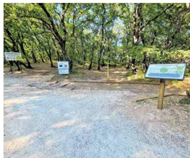
Posjetitelji poučne staze mogu se informirati o općekorisnim funkcijama šuma

posebnim stablom, pa je tako kod brojnih europskih kultura bio posvećen vrhovnim božanstvima. Bio je simbol Zeusa u staroj Grčkoj, Jupitera u starom Rimu i Peruna kod starih Slavena (vrhovno božanstvo, bog groma i munje). Po dolasku kršćanstva u naše krajeve moguće je da je Perun ovdje zamijenjen svetim Vidom jer upravo tako se zove najveći vrh na Pagu (Sv. Vid, 349 m). U staroslavenškoj mitologiji postoji vjerovanje da će onoga tko obori zdrav hrast sustiže nesreća. I zato, kako se hrastova stabla ne bi rušila, 'donosila nesreću' i uništavala probijanjem staza, »Natura-Jadera« JU je osmislila, prijavila i odradila s Gradom Pagom i TZ Grada Paga spomenuti projekt »Uređenje poučne staze u posebnom rezervatu šumske vegetacije »Dubrava-Hanzina« koji je upravo završio. Vrijednost projekta iznosio je 656.625,00 kn kojeg je javna ustanova »Natura-Jadera« osigurala kroz Program ruralnog razvoja RH za razdoblje 2014.-2020.