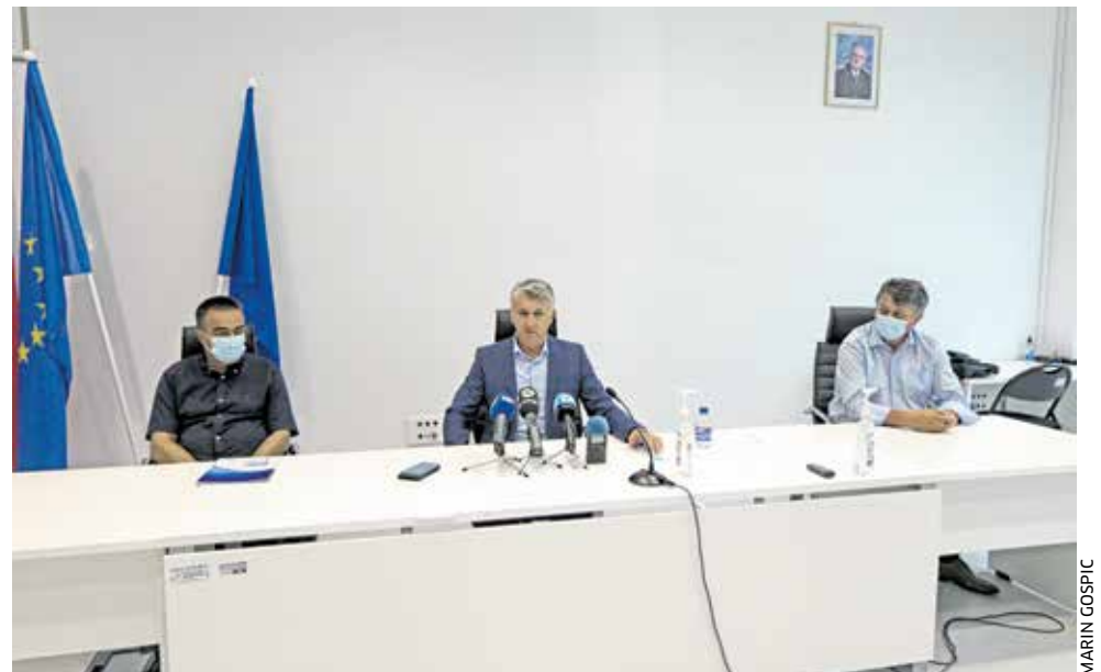
Na dnevnom redu sastanka župana s načelnicima i gradonačelnicima brojne teme