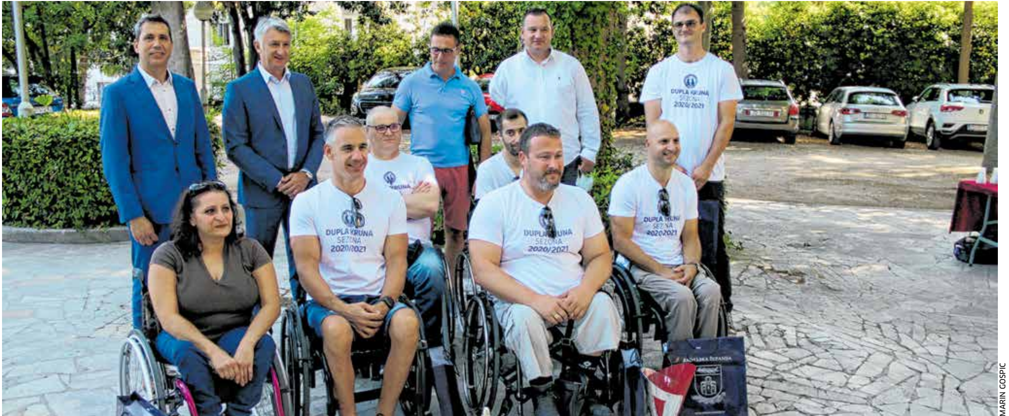
Župan s članovima KKOI Zadar koji su ove godine osvojili dvostruku krunu

PRIMANJE ČLANOVI KOŠARKAŠKOG KLUBA OSOBA S INVALIDITETOM ZADAR KOD ŽUPANA LONGINA