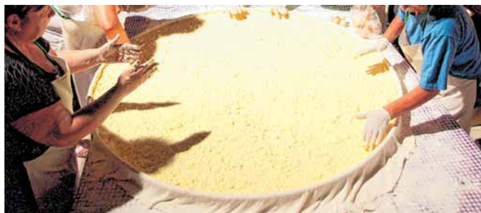
Benkovacki prisnac autohtona delicija Bukovice i Ravnih kotara