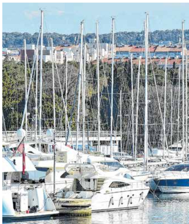
Zadarska županija s 4233 veza prednjači u ukupnim kapacitetima