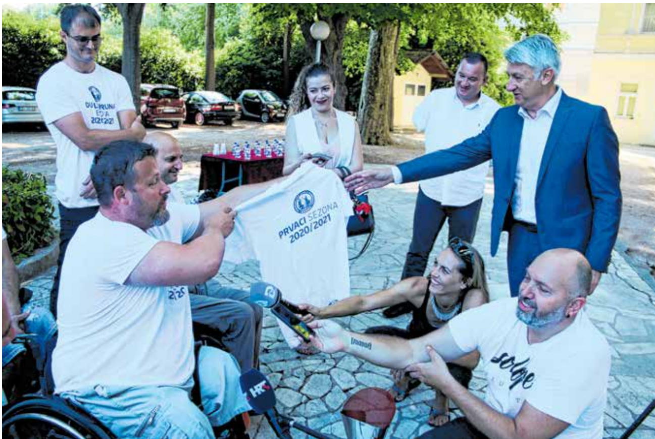
Primanje je održano u dvorištu Doma Zadarske županije