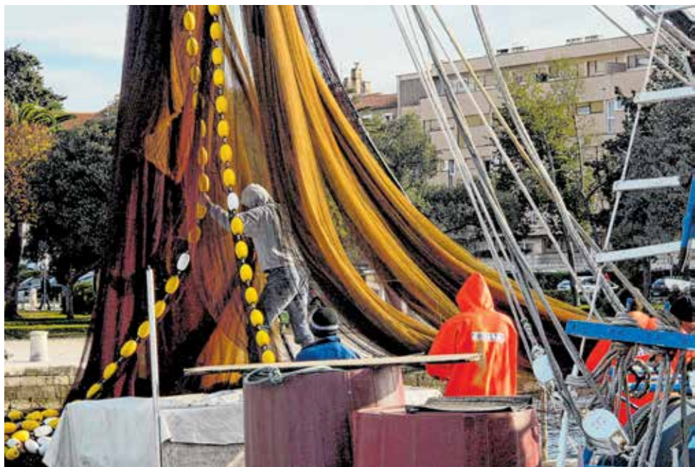
Dio zadarske kulinarske baštine neraskidivo je povezan s morskim ulovima

Web stranica će sadržavati sve novosti i trenutne aktivnosti vezane uz projekt, također će na stranici biti prikazan jedan od glavnih rezultata projekta, a to su staze kulinarske baštine koje će biti ucrtane na interaktivnoj mapi. Staze kulinarske baštine imat će poseban odjeljak na web-stranici i sadržavat će sve prikupljene recepte, načine pripreme jela, te zanimljive činjenice s terena, koje će biti pregledne i podijeljene po regijama.