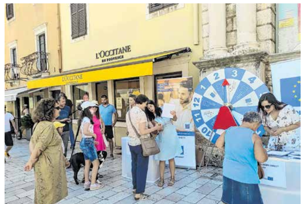
Cilj događanja je bio predstaviti javnosti EUROPE DIRECT Zadar i aktivnosti Europske unije