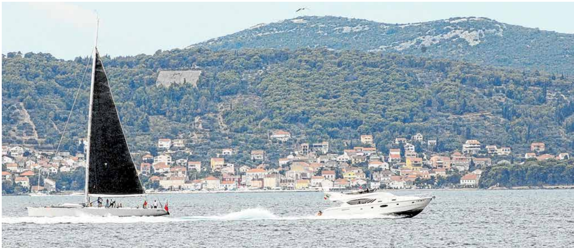
Netaknuta priroda, kao i razvedenost obale i otoka zadarskog arhipelaga raj za nautičare