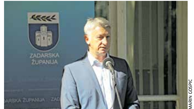
Županova čestitka na osvojenim košarkaškim trofejima