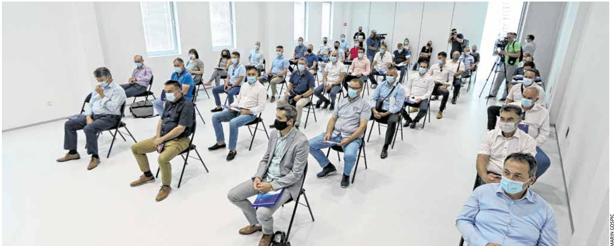
Na sastanku se razmotrila i trenutačna situacija u županiji, osobito u epidemiološkom smislu

PRVI NAKON IZBORA ŽUPAN ODRŽAO RADNI SASTANAK S GRADONAČELNICIMA I NAČELNICIMA