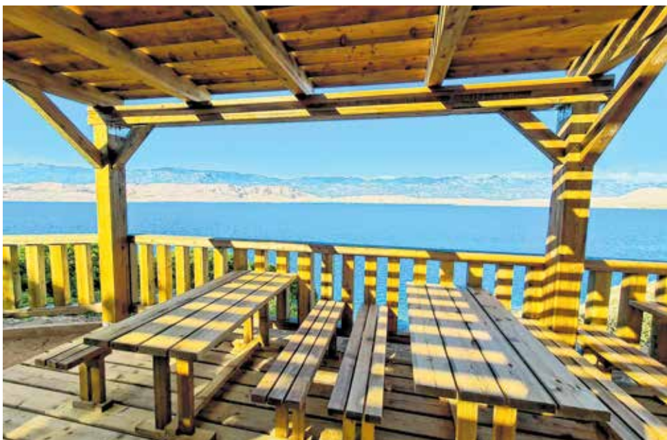
Još jedan razlog više za uživanje u prirodi

- Kroz projekt je uređena staza, postavljene su edukativne ploče od kojih dvije i na Brailleovom pismu te je izgrađen preljepi drveni vidikovac s klupama i stolovima za odmor i druženje s kojeg puca pogled na Paški zaljev. Malo ljudi zna da je taj zaljev u pradaavno doba (miocen) bio jezero u kojem su živjeli i krokodili. To, i još puno toga o samoj šumi hrasta medunca možete doznati kratkom ugodnom šetnjom u hladovini po našoj novoj poučnoj stazi«, rekao je ravnatelj Natura JADERE Damir Perić.