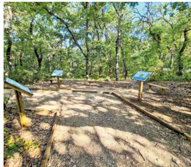
Uređenje je sufinancirano sredstvima Europske unije