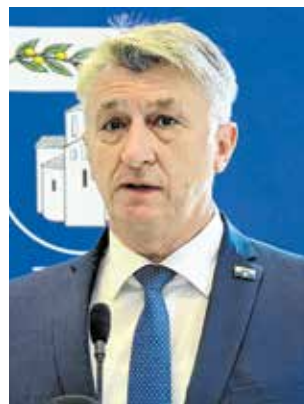
Župan Longin - cilj nam je brendirati Zadarsku županiju kao eno-gastro destinaciju

izgradnje nekoliko sustava navodnjavanja. Potencijal naše poljoprivredne proizvodnje je iznimno velik, a potporama za ruralni razvoj želimo pomoći u podizanju kvalitete postojećih i otvaranju novih seoskih gospodarstava. Naši su proizvođači napravili velik iskorak u kvaliteti, a zajednički nam je cilj brendirati Zadarsku županiju kao eno-gastro destinaciju za što svakako imamo veliki potencijal, poručio je