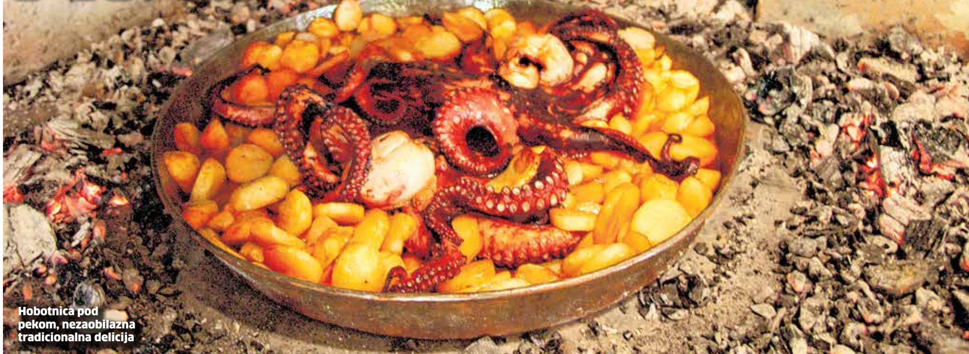
Hobotnica pod pekom, nezaobilazna tradicionalna delicija

N a projektu »Enhancing Sustainable Tourism Development through Culinary Heritage - CUHaCHA«, čiji je nositelj Agencija za ruralni razvoj Zadarske županije – AGRRRA, počela je izrada tradicionalnih kuhinja koje će biti izrađene u sva tri partnerska grada, Zadru, Mostaru i Tivtu. Izrada kuhinja ima za svrhu održavanje radionica dionicima projekta, koji će biti u mogućnosti usvajati znanja i vještine vezana uz stara jela, recepte i načine priprema jela, te će se moći prezentirati u svojim ugostiteljskim objektima. Planiran završetak radova svih kuhinja je prosinac 2021. godine.