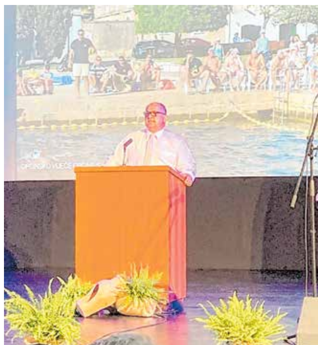
Općinski načelnik Zoran Pelicarić