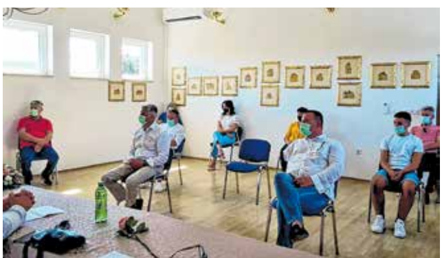
Svečana sjednica zbog pandemije održana u skromnijim uvjetima

DAN OPĆINE ZEMUNIK DONJI OBILJEŽEN BLAGDAN KRALJICE MIRA