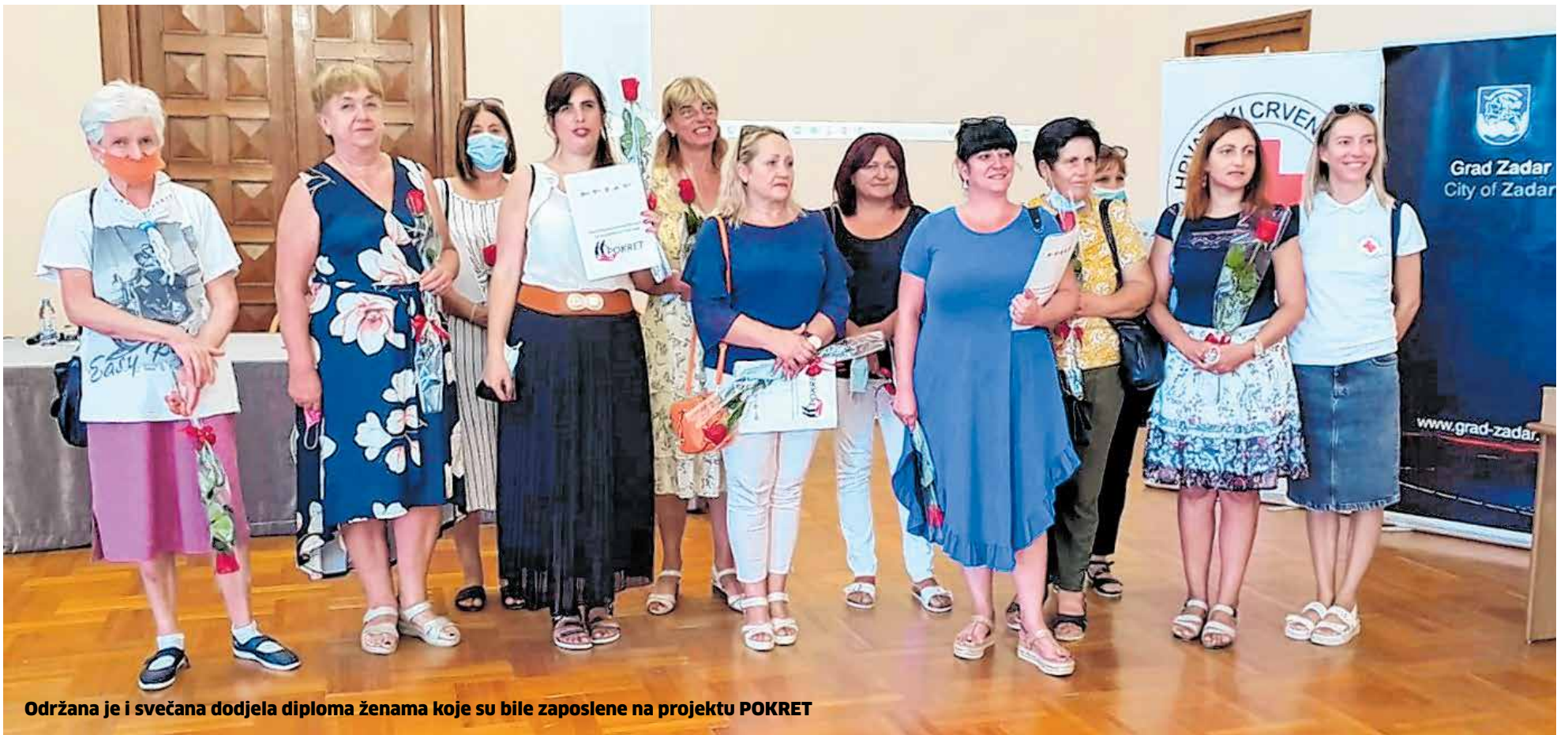
Održana je i svečana dodjela diploma ženama koje su bile zaposlene na projektu POKRET