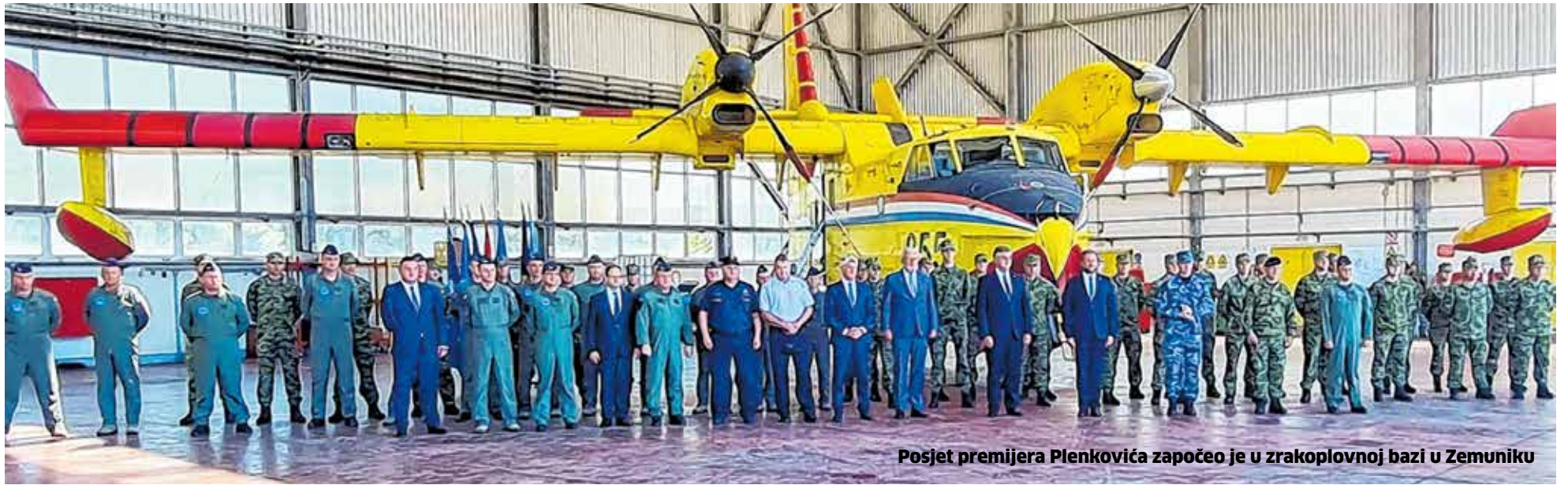
Posjet premijera Plenkovića započeo je u zrakoplovnoj bazi u Zemuniku

Razgovarali smo o novom projektu koji je u pripremi, vodovodizaciji cijele županije. To je jedan od najvećih projekata koji će se dogoditi na ovom prostoru, a potpomognut je Europskim fondovima. Imamo dijelova naše županije koji još nemaju vodu, a ova mreža je dotrajala te su gubici veliki. Projekt je vrijedan 11,7 milijardi kuna i nadamo se da će tijekom idućeg mjeseca biti gotova potrebna dokumentacija, kazao je župan Longin