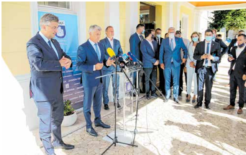
Susret u Zadarskoj županiji

stima te omogućili da ne bude nikakvog egzistencijalnog problema za zadarske obitelji. Ta činjenica se vidi u zaista kvalitetnoj pripremi turističke sezone koja se uspoređuje više s rekordnom 2019., nego s proteklom 2020. godinom. Dobrim epidemiološkim mjerama osigurali smo siguran boravak u Hrvatskoj, izjavio je premijer Plenković i najavio da će u suradnji s Zadarskom županijom i Gradom Zadrom nastaviti s projektima koje se tiču svih resora u »središtu hrvatskog ribarstva«.