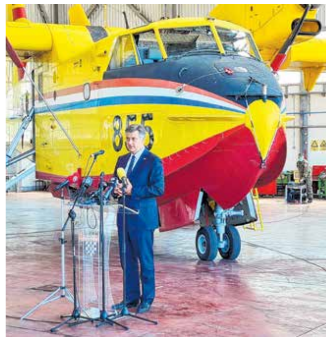
Premijer je istaknuo zadovoljstvo rastom gospodarskih aktivnosti u Zadarskoj županiji

- Povećani su prihodi županije, grada i općina, te smo donirali više sredstava i mogućnosti kako bi financirali svoje projekte, mogućnosti i političke prioritete. U Zadarskoj županiji više od 4000 poslodavaca koristilo je mjere pomoći, a na taj način smo zadržali ljude na radnim mje-