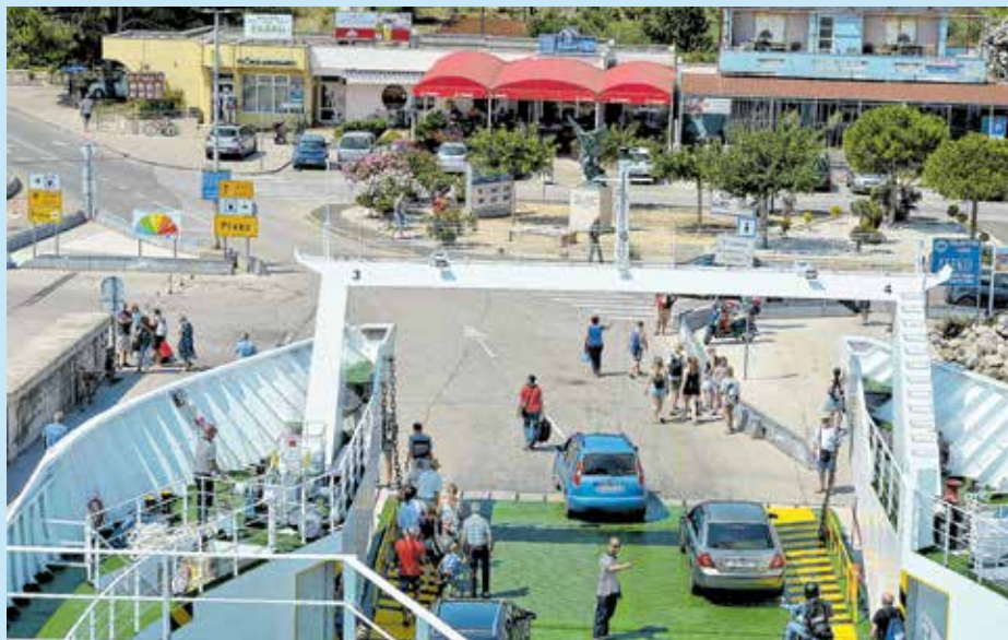
Preko - sigurna destinacija za brojne turiste

U tijeku je, doznajemo dalje, i rekonstrukcija dječjeg vrtića Ugljan tj. proširenje kapaciteta postojećeg vrtića čime će se omogućiti provođenje programa cjelodnevnog boravka u vrtiću te na taj način zadovoljiti potrebe brojnih roditelja koji su već iskazali veliki interes za tom uslugom i kojima je boravak