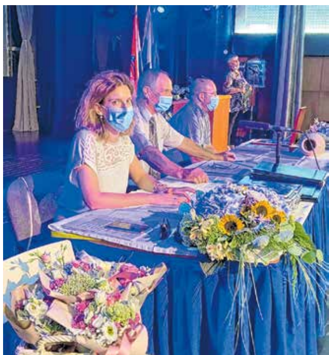
Svečana sjednica održana je u novoobnovljenoj kino dvorani