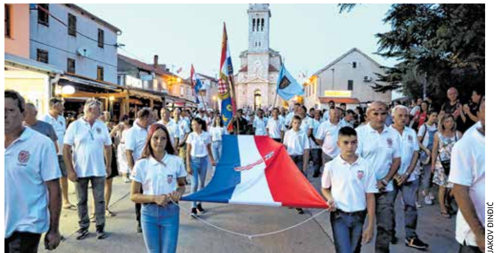
Impresivan mimohod s hrvatskom zastavom od crkve do »šandarca«