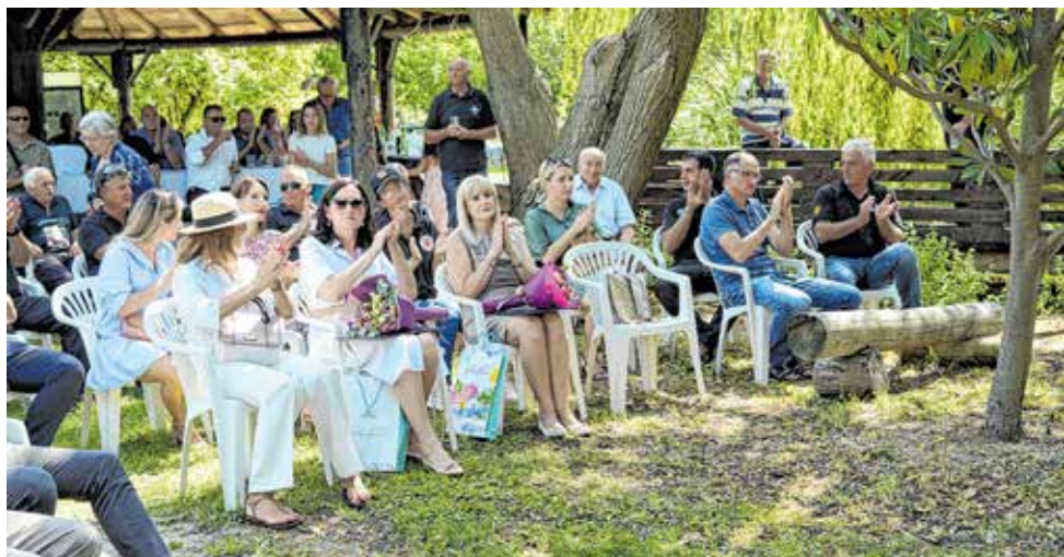
Molitva i pljesak u svetištu u Vrani

Svečanost je započela svetom misom u mjesnoj crkvi Uzasaša Gospodinova na kojoj se blagoslovlila hrvatska zastava. Od crkve do obližnjeg »šandarca« branitelji u pratnji djece nosili su zastavu do mjesta podizanja. Svečanosti su prisustvovali i ministar branitelja i potpredsjednik vlade RH Tomo Medved, saborski zastupnik Ante Deur, državni tajnik Šime Mršić, zamjenik župana Zadarske županije Šime Vicković te umirovljeni general Ante Gotovina.