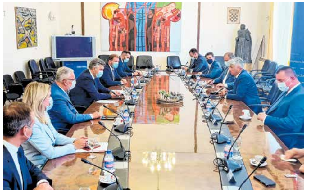
Radni sastanak održan je u Domu Zadarske županije