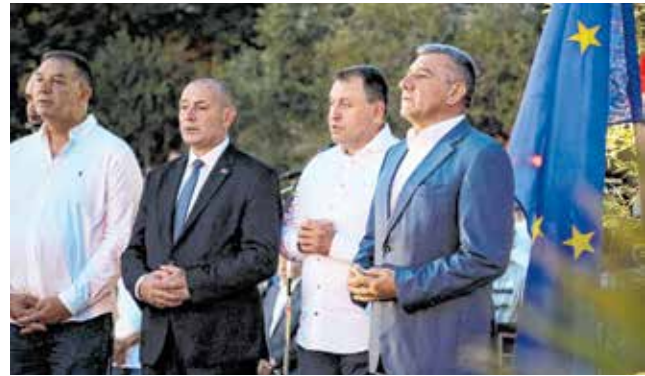
Svečanosti su, uz brojne goste, nazočili ministar Tomo Medved i general Ante Gotovina

privatnog prostora. Imamo u planu gradnju novih kapaciteta. Puno toga se napravilo, a zajedničkim snagama realizirat ćemo i nove projekte na dobrobit svih naših mještana, kazao je načelnik Kurtov.