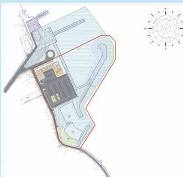
Trajektno pristanište u Preku - 3. završna faza

- Uskoro nam stiže i novi brod za hitnu pomoć kojim ćemo osigurati bolju i kvalitetniju medicinsku pomoć za stanovnike i turiste oba otoka, ističe dalje načelnik Općine Preko, te navodi kako osim infrastrukturnih projekata