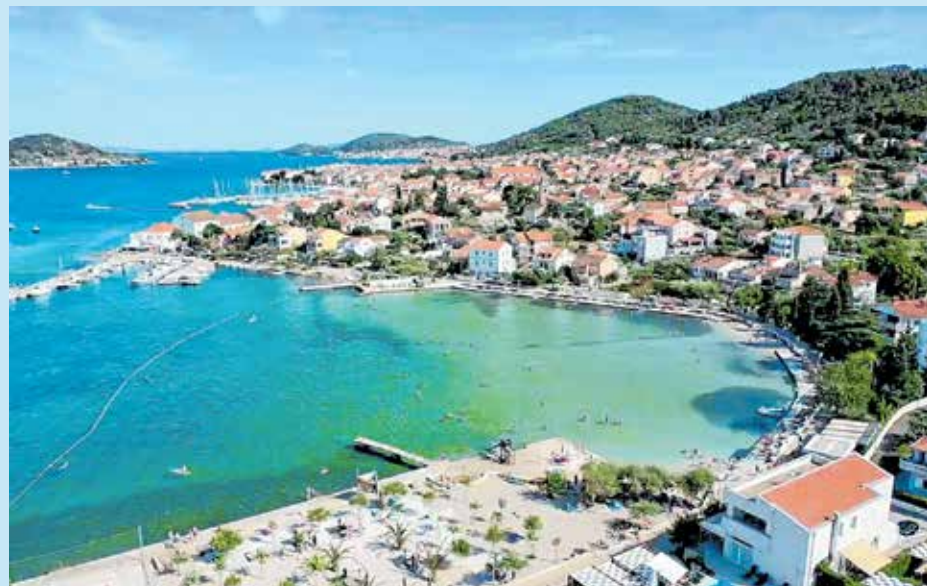
Nedavno su završeni radovi na plaži Jaz u sklopu kojih je sanirana postojeća obala