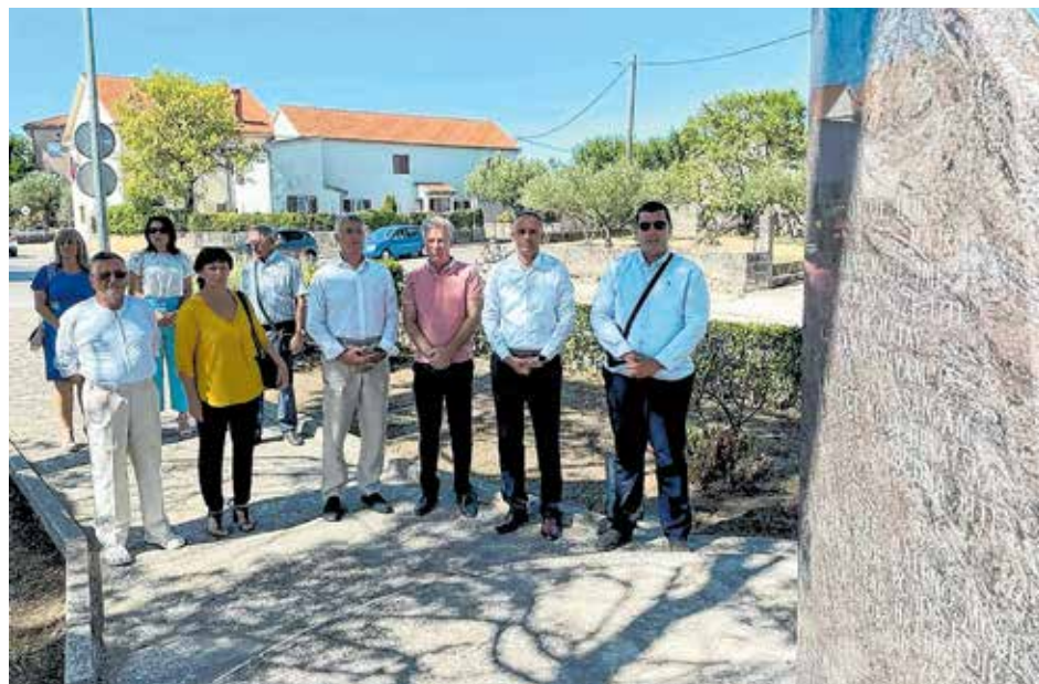
Vijenci i svijeće kod spomen obilježja palim braniteljima

Uoči Svečane sjednice položeni su vijenci i zapaljene svijeće kod spomen obilježja palim hrvatskim braniteljima iz Domovinskog rata te kod središnjeg križa na mjesnom groblju.