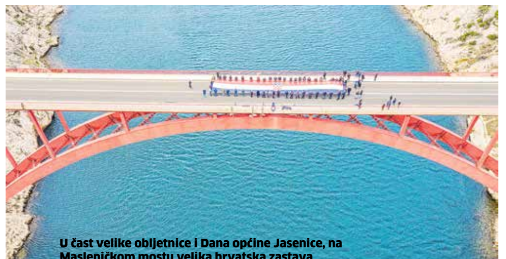
U čast velike obljetnice i Dana općine Jasenice, na Masleničkom mostu velika hrvatska zastava