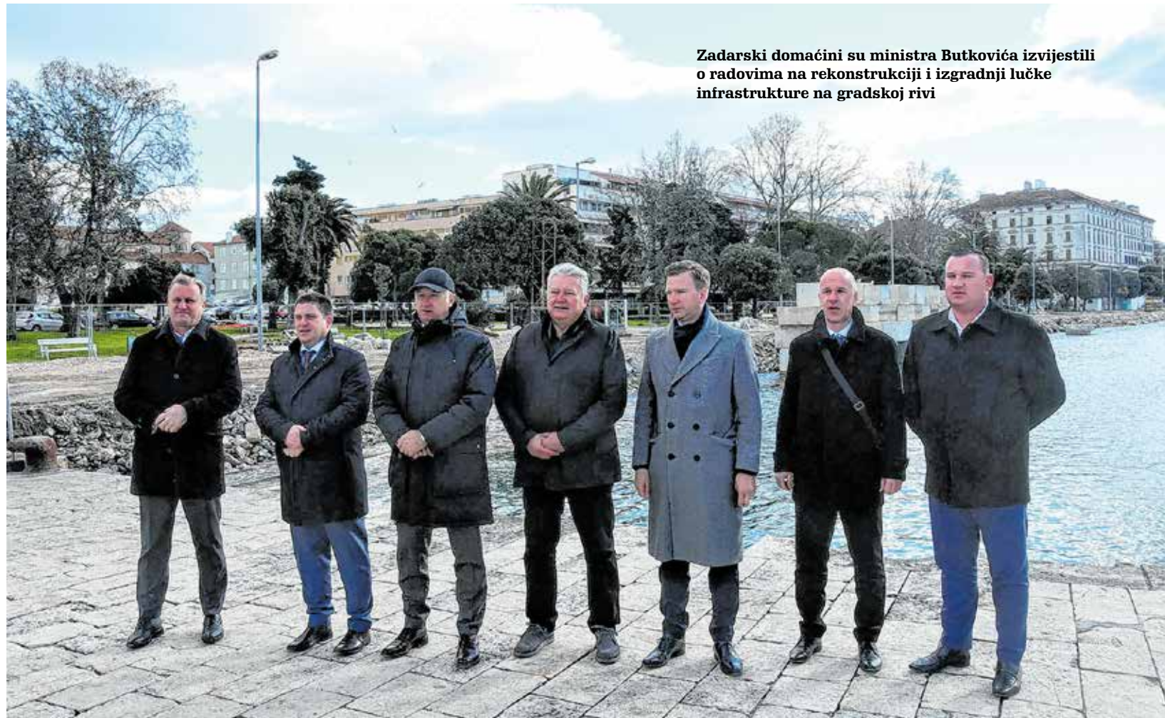
Zadarski domaćini su ministra Butkovića izvijestili o radovima na rekonstrukciji i izgradnji lučke infrastrukture na gradskoj rivi

- Još jedan vrlo bitan detalj jest spoj Zračne luke na četverotračnu cestu koja će rasteretiti dio prema Zadru i