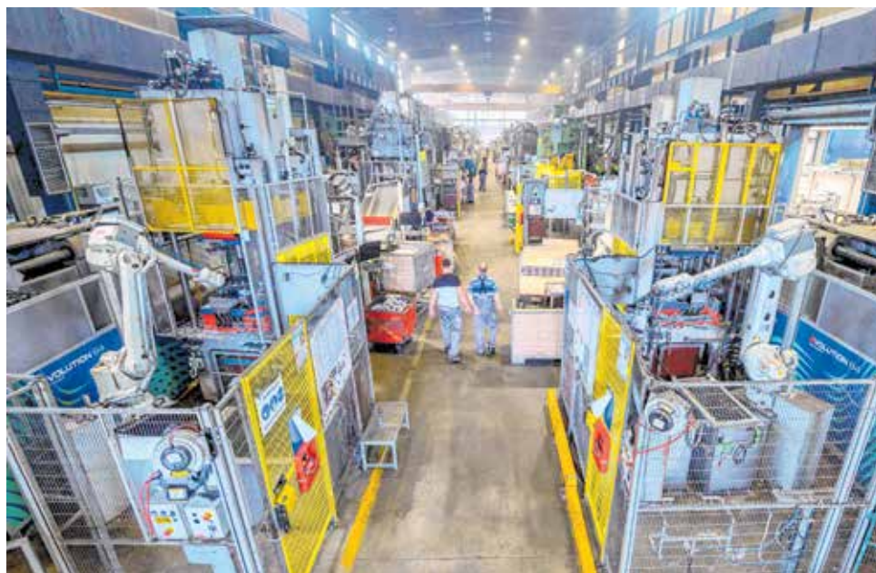
Prerađivačka industrija zapošljava velik broj ljudi - LTH Metalni lijev u Benkovcu

Održavanje visokog stupnja zaposlenosti u kriznim vremenima odlika je gospodarstva Zadarske županije, a uzlazni trend u zapošljavanju jači je od onog na državnoj razini, što je posljedica rasta turističkog prometa, ali i rasta zaposlenosti u drugim sektorima (prerađivačka industrija, građevinarstvo, administrativne djelatnosti...), pokazala je analiza Upravnog odjela za gospodarstvo, turizam, infrastrukturu i EU fondove Zadarske županije.