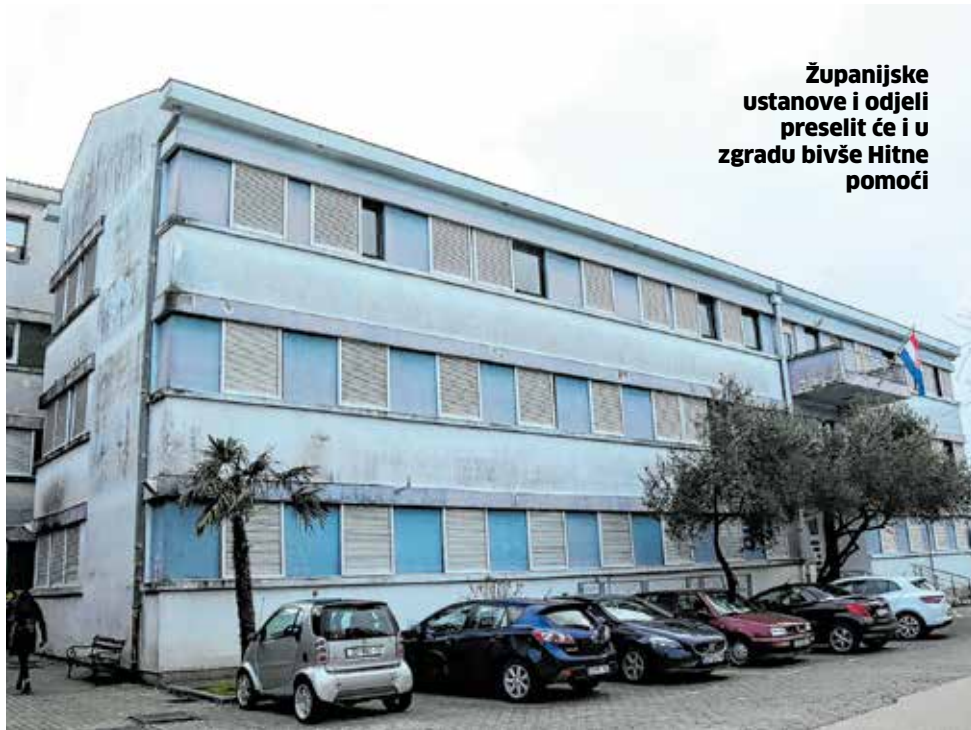
Županijske ustanove i odjeli preselit će i u zgradu bivše Hitne pomoći

Iz ovogodišnjeg proračuna sufinancirat ćemo otvaranje start-up tvrtki i izgradnju ukupno 40 dječjih igrališta kroz iduće četiri godine, povećat ćemo subvencije za smještaj u privatnim domovima za starije i nemoćne s 500 na 800 kuna mjesečno, a krenut ćemo i u realizaciju izgradnje novih domova, rekao je župan