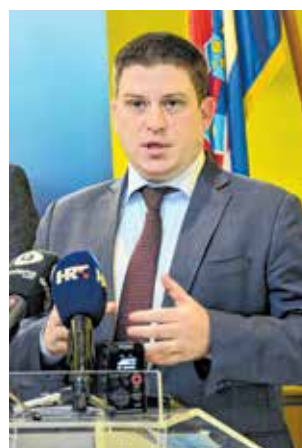
Oleg Butković, ministar mora, prometa i infrastrukture

- Običi ćemo radove na rivi u Zadru. To je, uz Tkon kao prvi europski projekt koji je krenuo uz podršku Ministarstva mora, prometa i infrastrukture i uz Sali, velik lučki projekt. Zadarska županija je tu jedna od uspješnijih županija. Naravno, pripremamo i dogovaramo novo financiranje što kroz financijsku