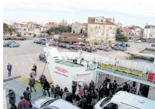
Izmještanje trajektnog pristaništa u Biogradu je u fazi izvođenja