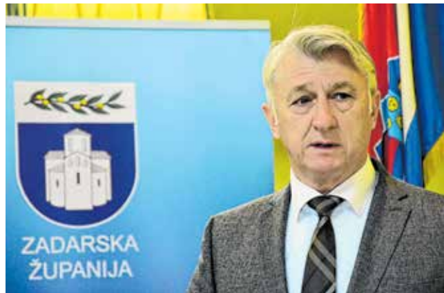
Božidar Longin, zadarski župan

„Kad je riječ o lukama, luka Biograd bi, po uzoru na Gaženicu, izmjestila lučki promet, taj je projekt u fazi izvođenja, a radi se i na luci Preko. Liniju Zadar - Ancona svakako treba oživjeti, tu smo svi suglasni