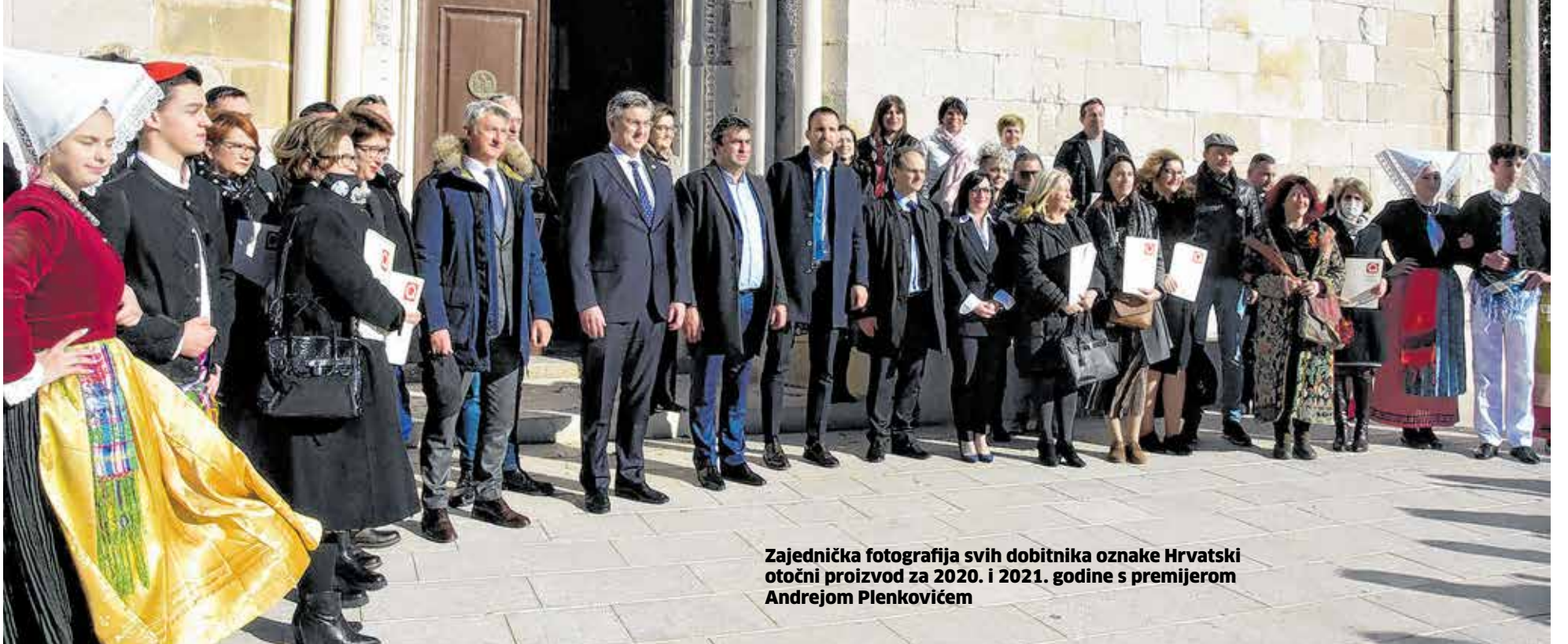
Zajednička fotografija svih dobitnika oznake Hrvatski otočni proizvod za 2020. i 2021. godine s premijerom Andrejom Plenkovićem

Mi ćemo na području ove županije nastaviti s financiranjem vodnog gospodarstva, vodoopskrbe, odvodnje, niza anglomeracija, bolje prometne povezanosti, rješavanja određenih pitanja koja su još eventualno na stolu, kazao je premijer Plenković