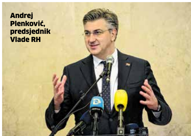
Andrej Plenković, predsjednik Vlade RH

“Vlada želi i održivo upravljanje otočnim resursima, uvažavanje specifičnosti i veću dostupnost infrastrukture i javnih usluga. Otoci će u budućnosti biti u fokusu jedne od najvažnijih globalnih tema – pitanja klimatskih promjena. S druge strane, uz zelenu tranziciju, važna je i digitalna tranzicija