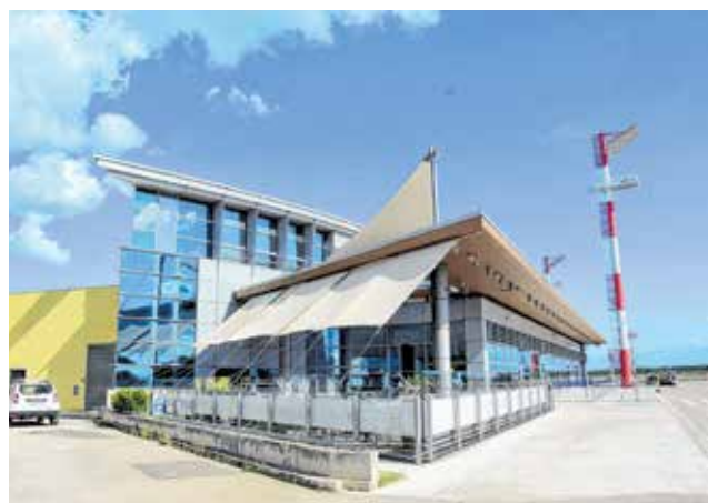
U Zračnoj luci Zadar ove godine treba početi izgradnja stajanke za zrakoplove i elektrane