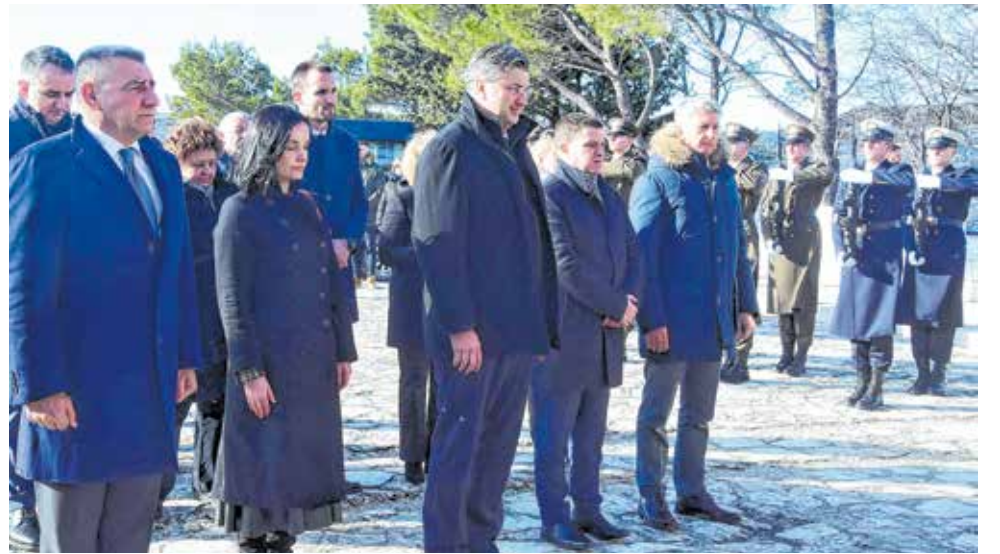
Položili su vijenac i zapalili svijeće kod spomen-obilježja križa u Maslenici

- Pag je poznat i po buri koja ga je oblikovala, ali mu pružila i prave darove prirode. Stoga, mnogi će reći da je Pag otok posebniji od drugih i da naši