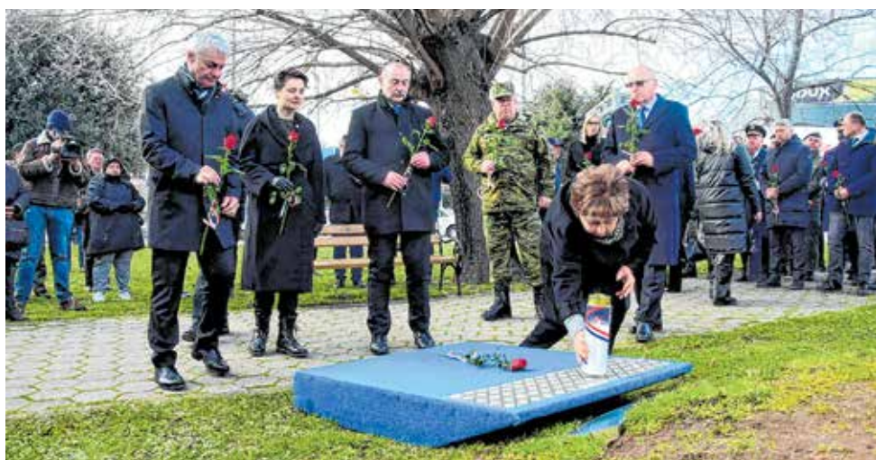
Ruže i svijeće ispred Kocke u Jazinama

Također, na dan VRO-e Maslenica se obilježava i Dan općine Jasenice. U vrijeme Domovinskog rata, Jasenice su doživjele pravu kalvariju u kojoj su četničke postrojbe potpuno spalile mjesto, a najveći dio pučanstva je izbjegao. Danas u starom dijelu Jasenice uglavnom živi starije stanovništvo, dok se najveći dio stanovništva stacionirao u Maslenici. Hrvatski branitelji su, u čast ove velike obljetnice i Dana općine Jasenice, preko Masleničkog mosta razvili hrvatsku zastavu dugu preko dvadeset metara. Veličanstven prizor hrvatske trobojnice koja se vijori sa simbola Domovinskog rata nikoga od prisutnih nije ostavio ravnodušnim.