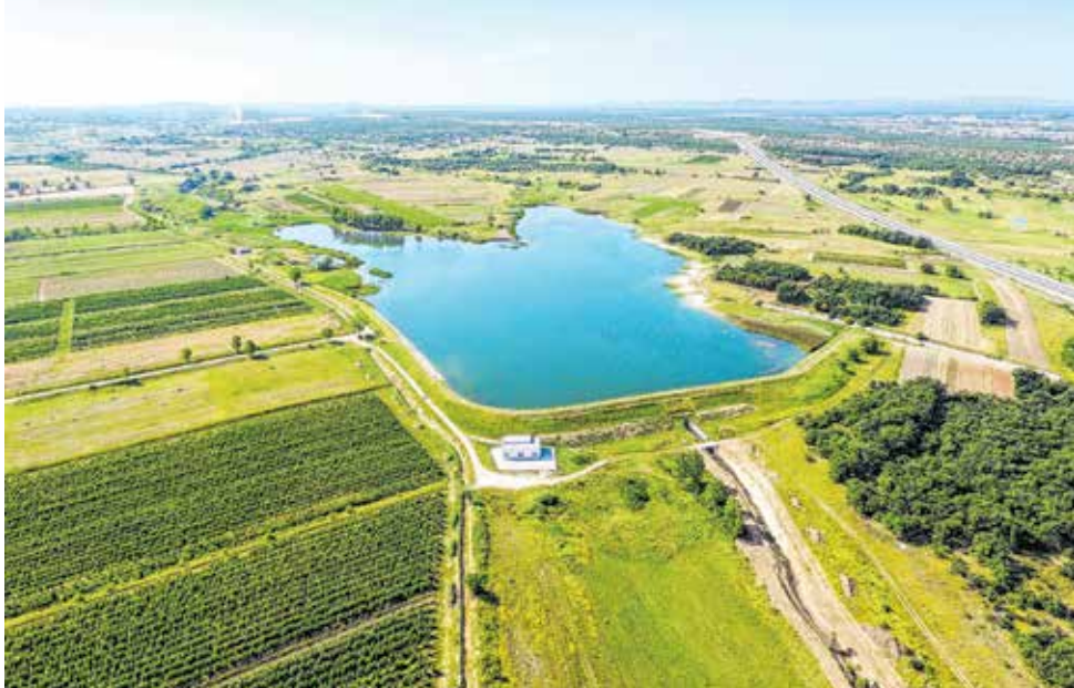
Ove godine očekuje se završetak sustava navodnjavanja Donja Baštica