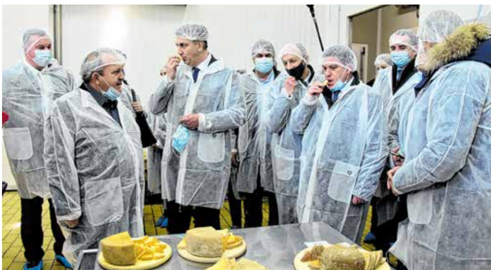
Posjetili su i Pašku siranu gdje se proizvode nagrađeni sirevi

Skrbe o njima kroz niz aktivnosti i na više područja - od izgradnje i rekonstrukcije luka u koje su samo kroz protekle