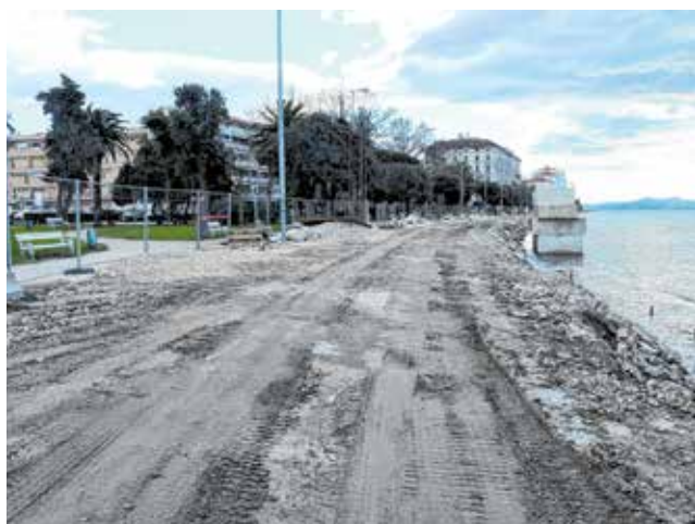
Gradska ljepotica zasjat će novim sjajem već do sezone

- To je jedan od projekata koji ćemo, nakon izrade početne studije, staviti u fazu projektiranja i izrade potrebne dokumentacije kako bismo mogli tražiti financiranje preko europskih fondova, rekao je Butković.