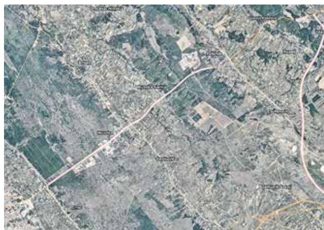
Dionica Jadranske ceste od Zadra do čvora autoceste Zadar 1 koja čeka proširenje

Ukupna vrijednost projekta »Rekonstrukcija i izgradnja lučke infrastrukture Grad Zadar-Poluotok« je 67.489.388,11 kuna, od čega 56.616.917,39 kuna sufinancira Europska unija iz Kohezijskog fonda, dok nacionalni doprinos iznosi 9.991.220,72 kuna.