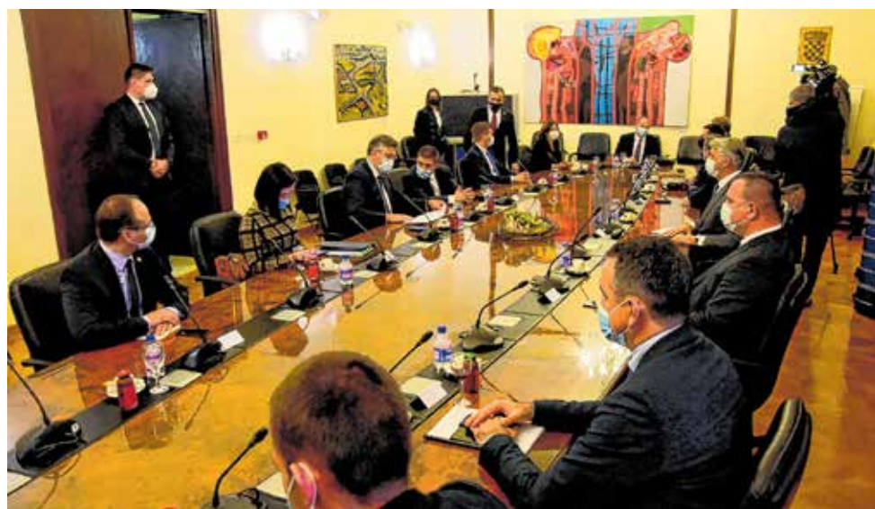
Sastanak s premijerom Plenkovićem u Domu Zadarske županije

- Drago mi je da su ocjene ovih proteklih godinu dana vrlo pozitivne, da je Zadarska županija ostvarila sjajne turističke rezultate, iznad svih očekivanja. Prema riječima župana, bili su na razini 2019. godine. Mi ćemo na području ove županije nastaviti s financiranjem vodnog gospodarstva, vodoopskrbe, odvodnje, niza angloamerikana, bolje prometne povezanosti, rješavanja određenih pitanja koja su još eventualno na stolu. Zatim, potpore poljoprivrednicima, ribarima, ovo je središte hrvatskog ribarstva. Naravno, i daljnji razvoj otoka o čemu je također bila riječ, zaključio je Plenković zahvalivši gradonačelniku, županu te njihovim suradnicima.