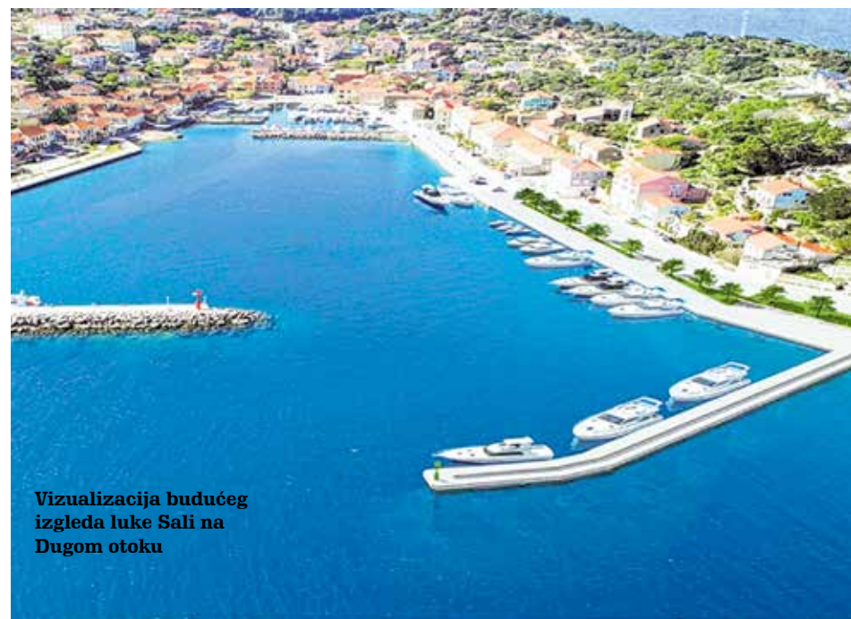
Vizualizacija budućeg izgleda luke Sali na Dugom otoku

ŽLU ove godine planira ukupno uložiti 80 milijuna kuna