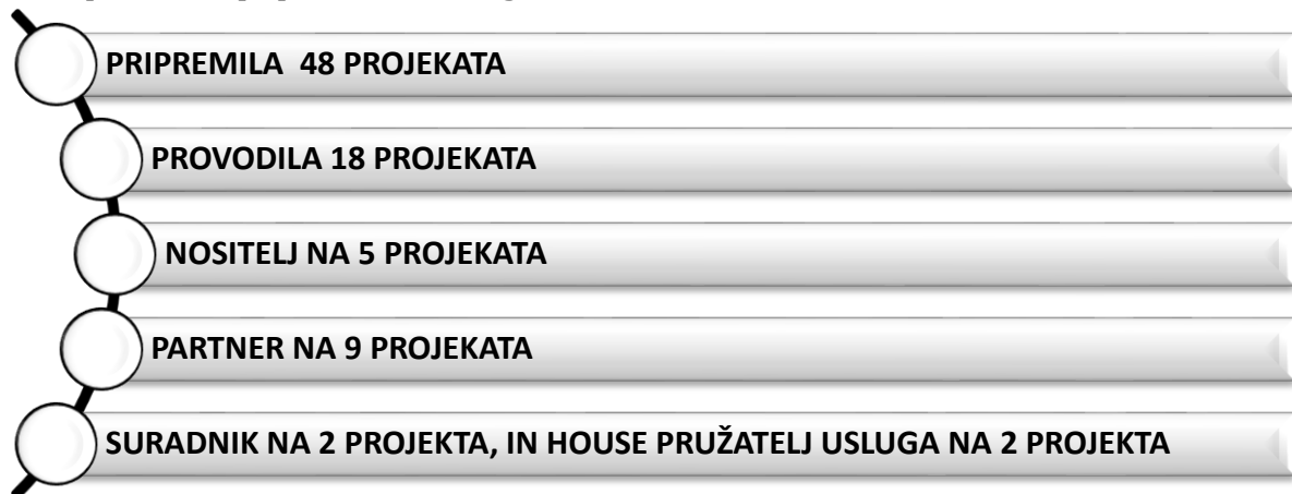
Slika 1: Shematski prikaz broja projekata koje je Agencija za razvoj Zadarske županije ZADRA NOVA provodila i pripremala u 2016. godini