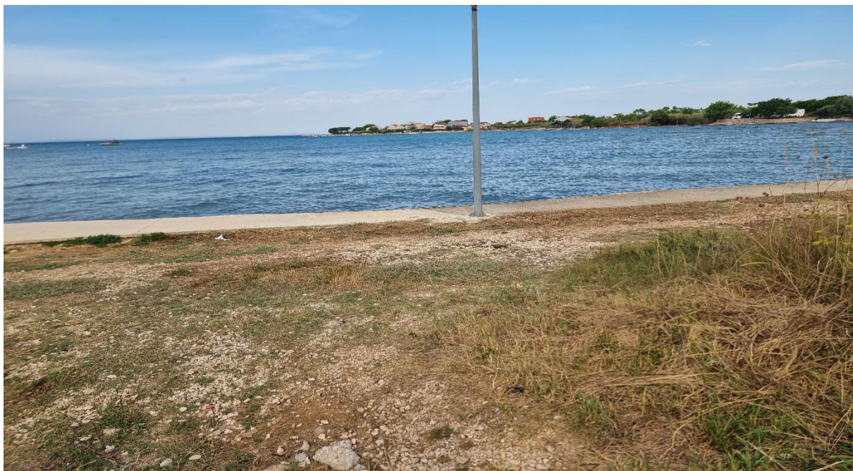
Fotografija 2: od točke 1 do točke 37