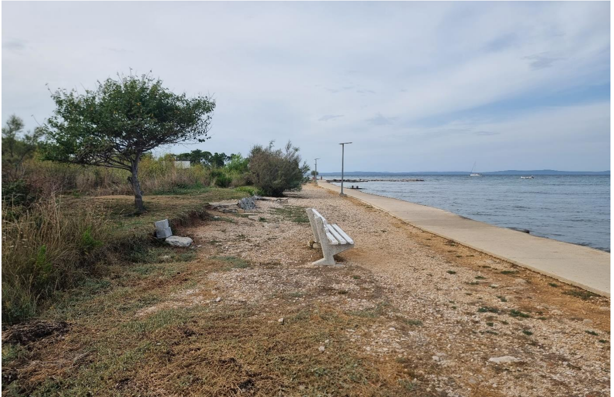
Fotografija 8: od točke 37 do točke 1