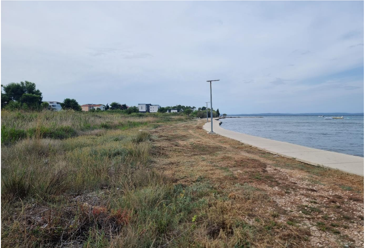
Fotografija 4: od točke 15 do točke 37