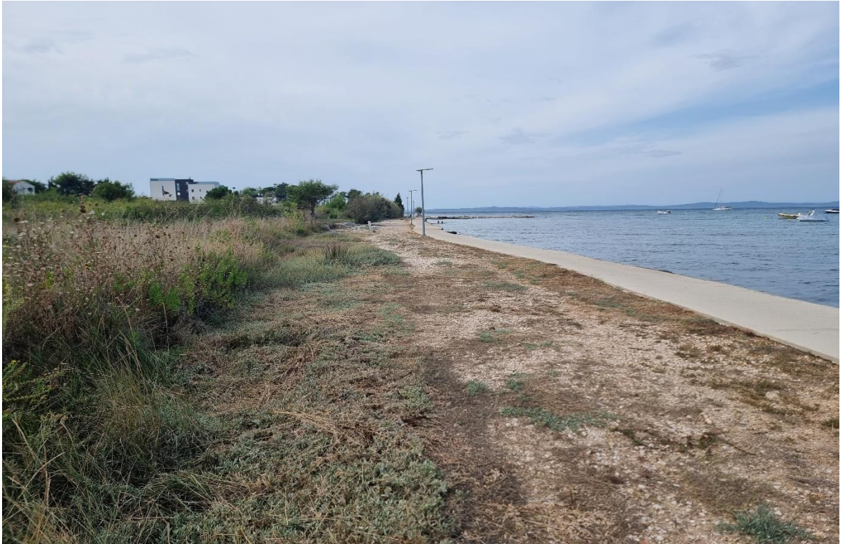
Fotografija 6: od točke 31 do točke 37